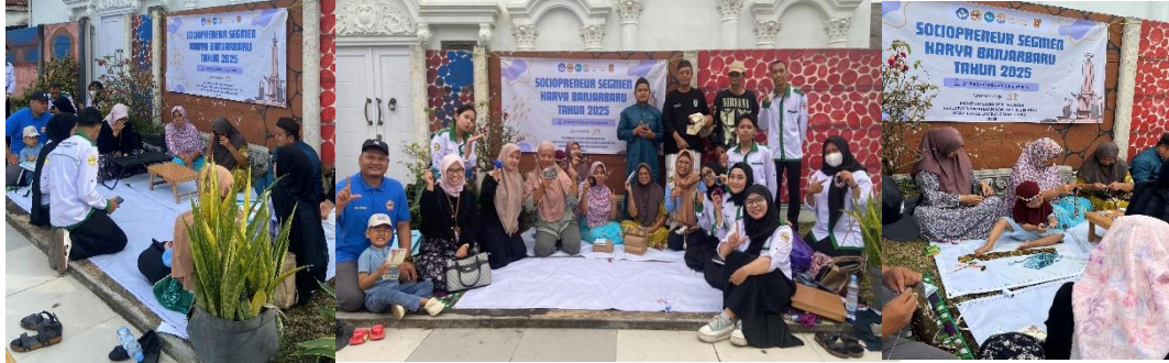
Gambar 3. Dokumentasi kegiatan edukasi

pemberdayaan masyarakat, karena kemandirian ekonomi tidak dapat dicapai secara instan tanpa adanya kesiapan mental dan orientasi kewirausahaan. Oleh karena itu, hasil kegiatan ini memperkuat argumentasi bahwa pendekatan sociopreneur berbasis potensi lokal merupakan strategi yang relevan dan aplikatif dalam pengabdian masyarakat perkotaan. Adapun kegiatan pelaksanaan dapat dilihat pada gambar berikut ini: