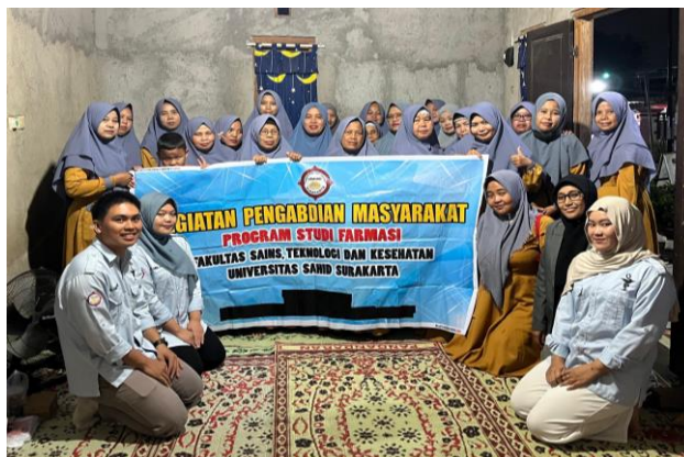
Gambar 3. Foto Bersama Tim Pengabdian dan Peserta