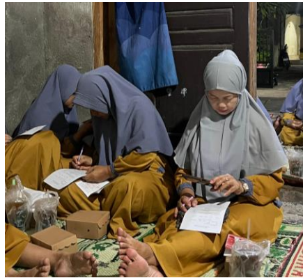
Gambar 2. Pengisian Kuesioner oleh Peserta

Setelah pengisian kuesioner, tim memberikan penjelasan tentang latar belakang pemilihan tema pada kegiatan ini. MASuk sesi pemberian materi, tim menggunakan materi powerpoint dari Ikatan Apoteker Indonesia yang dicanangkan dalam Gerakan Keluarga Sadar Obat. Materi yang disampaikan meliputi pengertian DAGUSIBU, cara mendapatkan obat dengan benar, cara menggunakan obat dengan benar, cara menyimpan obat dengan benar, dan cara buang obat yang benar. Sesi pemberian materi berlangsung sekitar 45 menit. Kemudian dilanjutkan sesi tanya jawab dengan Sebelum kegiatan ditutup, evaluasi dilakukan dengan pengisian kuesioner posttest . Jawaban posttest akan dibandingkan dengan jawaban pretest , untuk mengetahui perbandingan tingkat pengetahuan.