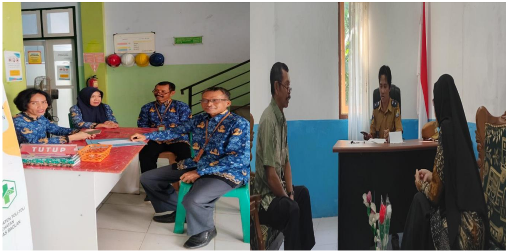
Gambar 3. Koordinasi dengan Kepala Puskesmas dan Kepala desa

oleh Kepala Puskesmas Baolan, Kepala Desa dan Pihak pelaksana kegiatan Pengabdian Masyarakat.