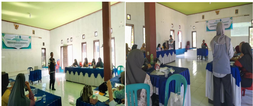
Gambar 5. Pemberian Materi pelatihan Kader