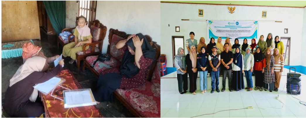
Gambar 6. Pendataan &amp; Penutupan