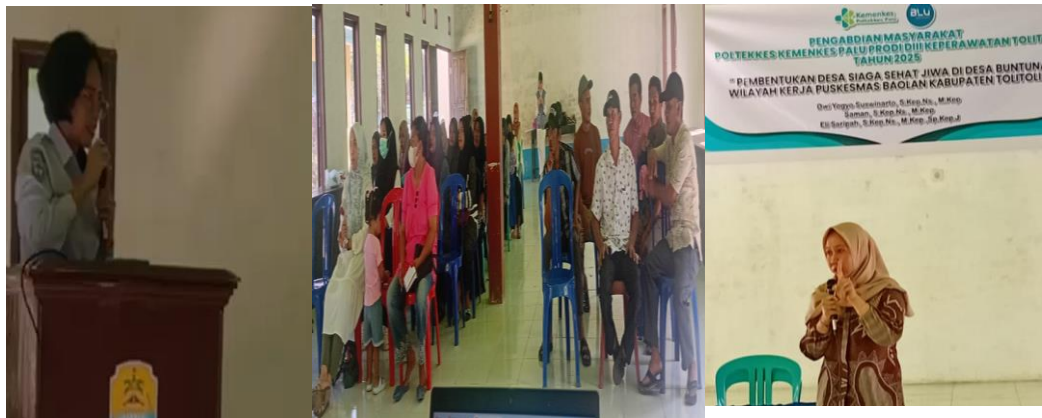
Gambar 4. Sosialisasi Upaya Keswa & DSSJ