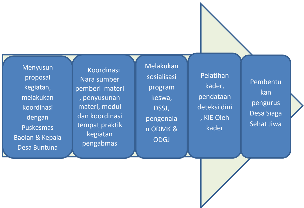
Gambar 2. Skema Tahapan Kegiatan Pengabmas

Tahap-tahap pelaksanaan kegiatan dimulai dari tahap persiapan administrasi (Perizinan, Koordinasi kegiatan dan narah sumber, Persiapan bahan). Tahap pelaksanaan Kegiatan; Pembukaan dibuka oleh Kepala Puskesmas, dilanjutkan sosialisasi Program Kesehatan Jiwa Di Puskesmas, Sosialisasi Desa Sehat Jiwa dan mengenal ODMK dan ODGJ, Pelatihan Kader kesehatan jiwa, melaksanakan deteksi dini masalah kesehatan jiwa oleh kader dan penyuluhan keluarga dengan anggota keluarga mengalami gangguan jiwa oleh kader didampingi instruktur, Pembentukan Pengurus Siaga Sehat Jiwa.