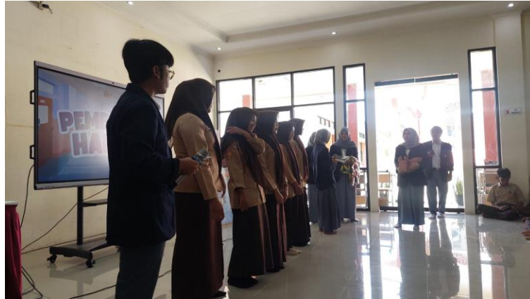
Gambar 4. Peserta terlibat aktif dalam kegiatan pengabdian

sekolah. Secara keseluruhan, hasil ini menunjukkan bahwa edukasi berbasis TPB berhasil meningkatkan pengetahuan, sikap, dan kesiapsiagaan siswa dalam upaya pencegahan kekerasan seksual.