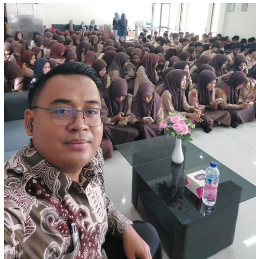
Gambar 3. Pengisian Pre Test oleh Peserta dari SMKN 2 Pangandaran

Secara kuantitatif, hasil pengukuran menunjukkan adanya peningkatan signifikan tingkat pengetahuan dan kesiapsiagaan siswa terhadap pencegahan kekerasan seksual. Nilai rata-rata pre-test sebesar 76,22 meningkat menjadi 84,70 pada post-test . Selain itu, jumlah siswa yang mencapai skor maksimal meningkat dari 47 siswa menjadi 91 siswa setelah pelaksanaan program. Hal ini menunjukkan adanya peningkatan bukan hanya pada rata-rata pengetahuan, tetapi juga peningkatan proporsi siswa yang memiliki pemahaman optimal.