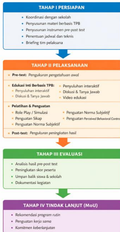
Bagan 1. Tahapan kegiatan pengabdian