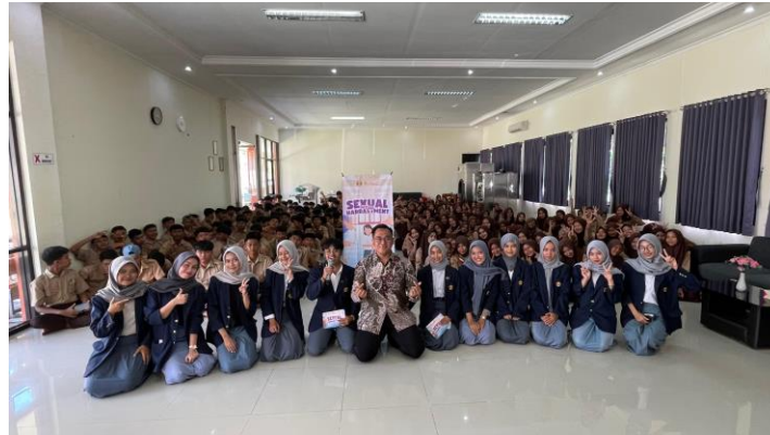
Gambar 2. Dokumentasi bersama Tim dan Peserta Kegiatan

Secara kuantitatif, hasil pengukuran menunjukkan adanya peningkatan signifikan tingkat pengetahuan dan kesiapsiagaan siswa terhadap pencegahan kekerasan seksual. Nilai rata-rata pre-test sebesar 76,22 meningkat menjadi 84,70 pada post-test . Selain itu, jumlah siswa yang mencapai skor maksimal meningkat dari 47 siswa menjadi 91 siswa setelah pelaksanaan program. Hal ini menunjukkan adanya peningkatan bukan hanya pada rata-rata pengetahuan, tetapi juga peningkatan proporsi siswa yang memiliki pemahaman optimal.