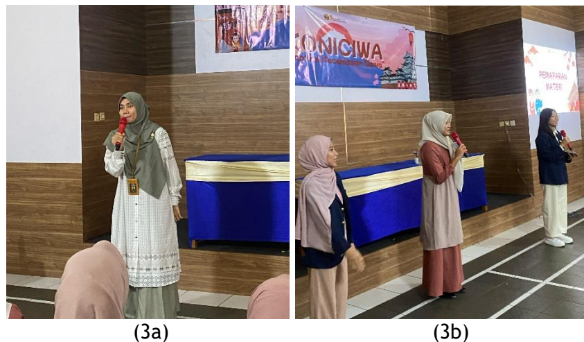
Gambar 3a dan 3b. Tim PPM Menyampaikan materi Psikoedukasi Teknik Breathing, Affirmation and Move (BAM) untuk mengatasi kecemasan pada siswa kelas XI di SMKN 1 Pangandaran

Setelah diberikan penyuluhan dan pelatihan, siswa menunjukkan peningkatan pemahaman mengenai konsep kecemasan serta pentingnya pengelolaan emosi dalam proses pembelajaran. Siswa mampu menjelaskan kembali komponen utama teknik BAM, yaitu latihan pernapasan terkontrol, afirmasi positif, dan gerakan tubuh sederhana sebagai satu rangkaian teknik pengelolaan kecemasan. Hasil pre-test dan Post-test disajikan pada table berikut: