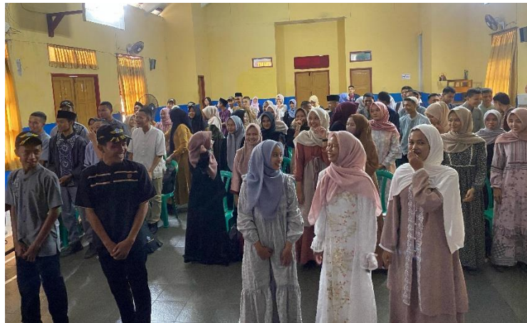
Gambar 4. Peserta mempraktikkan Teknik Breathing, Affirmation and Move (BAM) untuk mengatasi kecemasan