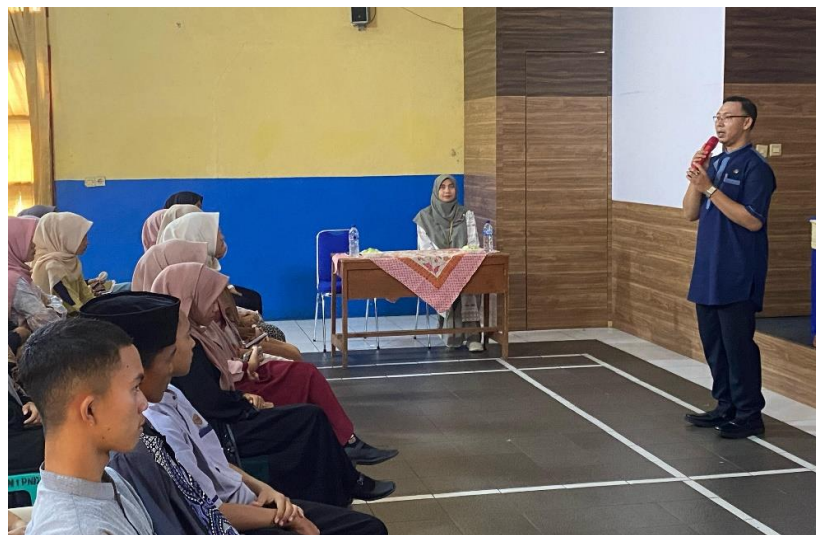
Gambar 2. Sambutan dan penerimaan pihak SMKN 1 Pangandaran kepada tim pelaksana kegiatan PPM Psikoedukasi Teknik Breathing, Affirmation and Move (BAM) untuk mengatasi kecemasan pada siswa

Kegiatan pengabdian kepada masyarakat melalui penerapan teknik Breathing, Affirmation, and Move (BAM) di SMKN 1 Pangandaran menunjukkan hasil yang positif dalam meningkatkan pengetahuan dan kemampuan siswa dalam mengelola kecemasan. Hasil kegiatan disajikan sesuai dengan rumusan pertanyaan yang berfokus pada pemahaman dan penerapan teknik BAM oleh siswa.