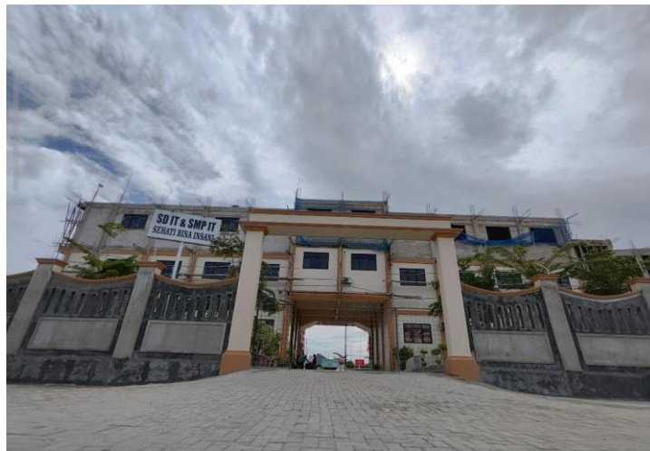
Gambar 4. Gedung SMK Sehat Karawang