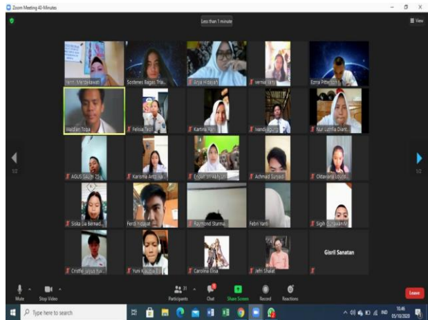
Gambar 3. Sesi Diskusi