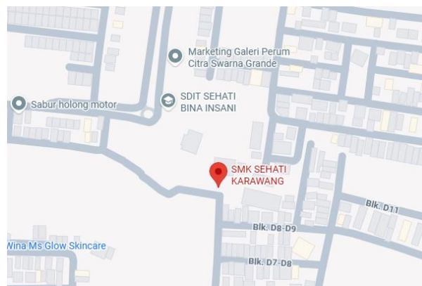
Gambar 1. Maps SMK Sehati Karawang

Bagaimana tingkat pengetahuan remaja tentang reproduksi remaja dalam mencegah pergaulan bebas sebelum dan sesudah dilakukan pemaparan edukasi reproduksi remaja?