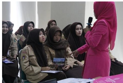
Gambar 3. Interaksi Dengan Mahasiswa

Interaksi selama kegiatan penyuluhan memegang peranan vital dalam meningkatkan daya serap pengetahuan siswa karena dapat mengubah arah komunikasi menjadi lebih partisipatif. Dengan metode yang digunakan dalam kegiatan ini yaitu Collaborative learning merupakan metode pembelajaran yang memberikan kesempatan siswa untuk berpartisipasi secara aktif dalam proses pembelajaran. Selain itu interaksi personal yang terjalin selama kegiatan bukan hanya menciptakan hubungan yang baik antara narasumber dengan audiens, namun meningkatkan kepercayaan serta motivasi (Putra et al., 2024).