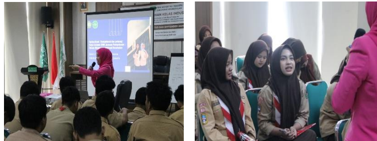
Gambar 4. Simulasi Pelayanan Prima ( Service Excellence )

Dalam pelaksanaan kegiatan pengabdian masyarakat ini juga diperkuat oleh adanya kegiatan simulasi pelayanan prima. Tujuan dari adanya kegiatan tersebut sebagai bentuk gambaran awal kepada siswa bahwa tenaga administrasi kesehatan manjadi garda pertama dan terdapan saat pasien mendapatkan atau berkunjung ke fasilitas kesehatan. Pada kegiatan ini diberikan contoh bagaimana memberikan pelayanan Simulasi Pelayanan Prima ( Service Excellence ) yaitu teknik komunikasi efektif dan penanganan keluhan pelanggan dalam konteks fasilitas layanan kesehatan guna meningkatkan soft skills siswa.