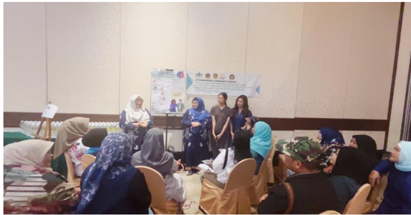
Gambar 2. Suasana saat penyuluhan