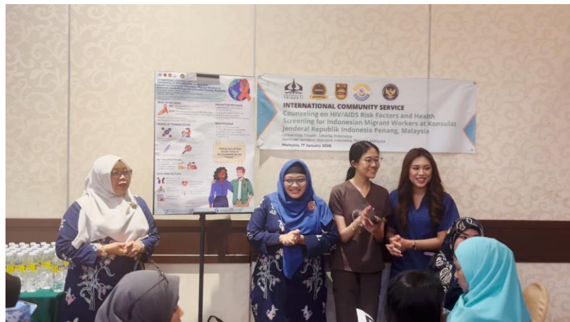
Gambar 3. Suasana saat sesi tanya jawab