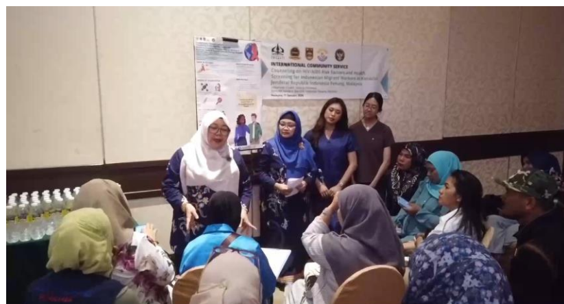
Gambar 4. Para peserta sangat antusias mencatat dan bertanya