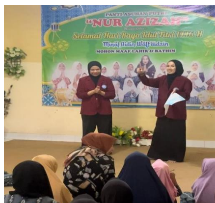
Gambar 3. Demostrasi tahapan CTPS

Kegiatan penyuluhan ini bertujuan untuk meningkatkan pengetahuan dan kesadaran anak-anak terhadap perilaku hidup bersih dan sehat, khususnya kebiasaan mencuci tangan dengan sabun pada waktu-waktu penting. Suasana kegiatan berlangsung kondusif dengan partisipasi aktif peserta yang memperhatikan materi yang disampaikan sebagai tahap awal sebelum dilakukan demonstrasi dan praktik langsung cuci tangan pakai sabun.