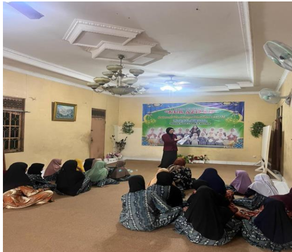
Gambar 2. Pemaparan materi

Tim Pengabdian kepada Masyarakat menyampaikan materi penyuluhan kesehatan kepada anak-anak Panti Asuhan Putri Nur Azizah Belitung mengenai pentingnya cuci tangan pakai sabun sebagai upaya promotif dan preventif dalam pencegahan penyakit menular. Penyampaian materi dilakukan secara langsung dengan metode ceramah interaktif menggunakan bahasa yang sederhana agar mudah dipahami oleh peserta.