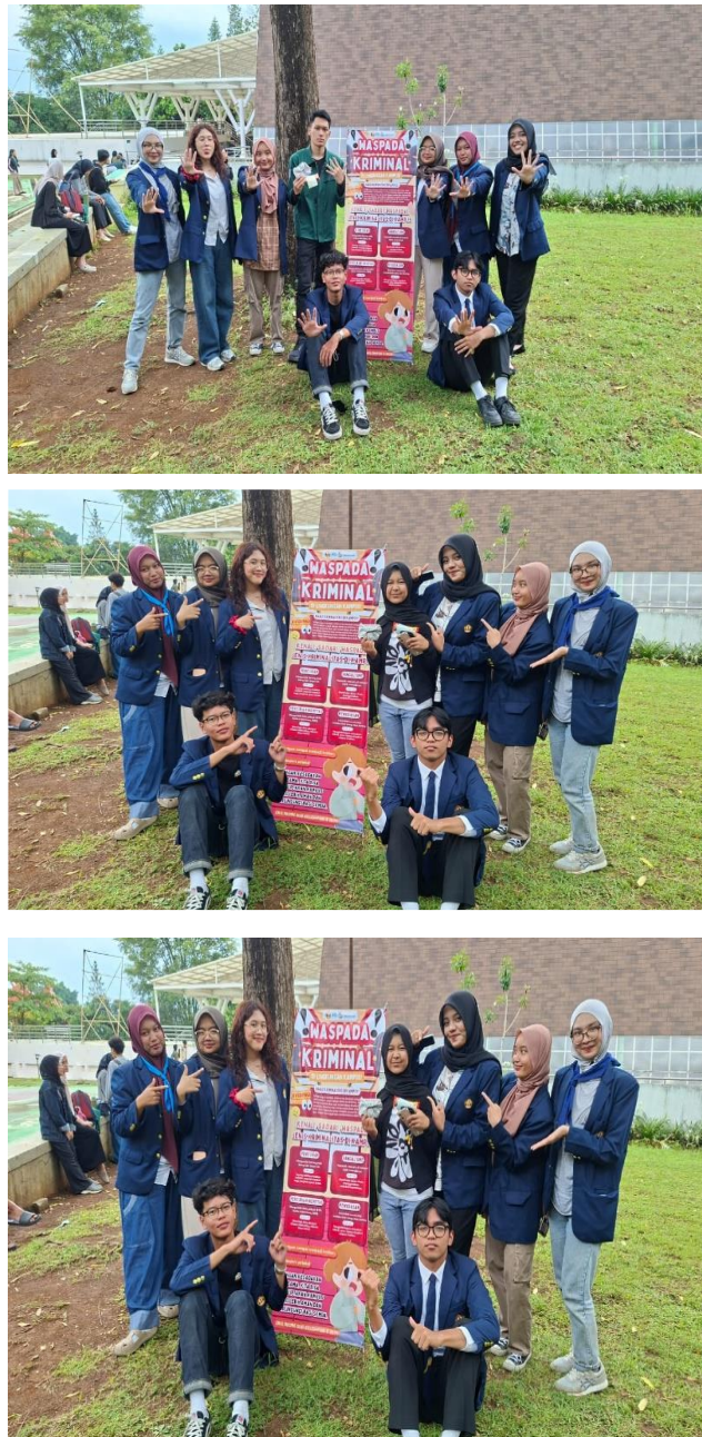
Gambar 3. Foto Kegiatan memberikan materi