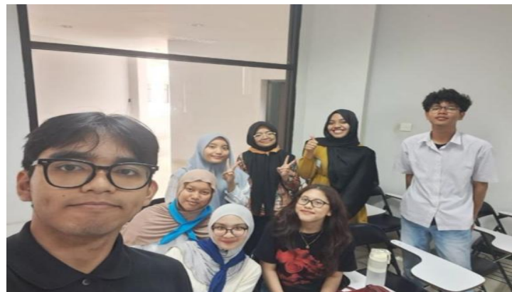
Gambar 2. foto kegiatan setelah diskusi