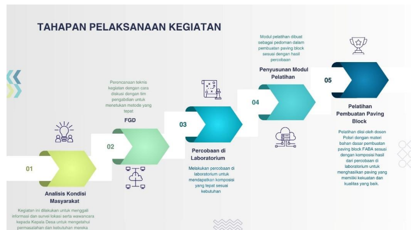
Gambar 3. Tahapan Pelaksanaan Kegiatan