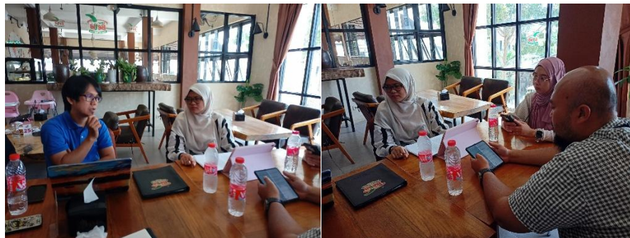
Gambar 4. Forum Grup Diskusi Tim Pengabdian

Survei diawali dengan kolaborasi TJSL PLN UIP Sumbagsel untuk memanfaatkan limbah FABA yang dihasilkan PLTU Sumsel, pertama mendiskusikan tentang kondisi lapangan mitra pengabdian dan permasalahan yang ada di Desa Penyandingan, dari survei tersebut permasalahan utama di Desa Penyandingan belum memiliki BumDes dan usaha untuk meningkatkan perekonomian masyarakat, melihat potensi yang ada seperti limbah FABA yang belum termanfaatkan secara maksimal, maka kolaborasi untuk memberikan pelatihan pemanfaatan FABA berbasis paving block untuk masyarakat Desa Penyandingan (Mayasari et al., 2022). Kegiatan dilanjutkan dengan Forum Diskusi Terfokus untuk membedah hasil pemetaan kondisi sosial masyarakat. Diskusi ini menjadi wadah untuk menentukan jenis intervensi atau kegiatan yang tidak hanya tepat sasaran secara teknis, tetapi juga menjawab aspirasi dan kebutuhan mendesak penduduk setempat (Mayasari et al., 2024).