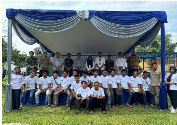
Gambar 6. Implementasi pelatihan pembuatan paving block