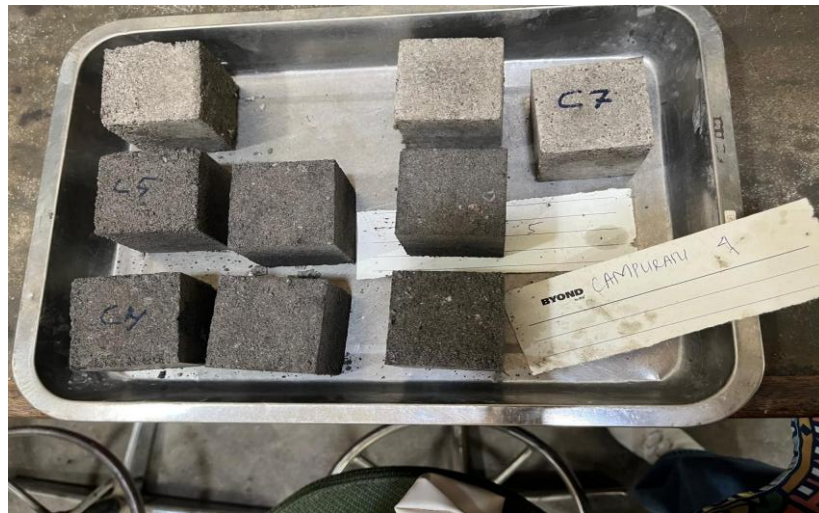
Gambar 2. Gambaran FABA dalam campuran paving block

Fly Ash dan Bottom Ash (FABA) merupakan limbah hasil pembakaran batu bara pada PLTU yang memiliki potensi sebagai material konstruksi alternatif. Fly ash bersifat pozzolan yang dapat meningkatkan kekuatan dan durabilitas beton melalui reaksi kimia dengan kalsium, sedangkan bottom ash berfungsi sebagai agregat halus pengganti pasir. Pemanfaatan FABA dalam campuran paving block terbukti mampu menghasilkan produk dengan mutu yang memenuhi standar teknis (Indonesia & Nasional, 1996), terutama dalam hal kuat tekan dan daya serap air (Kim, 2015).