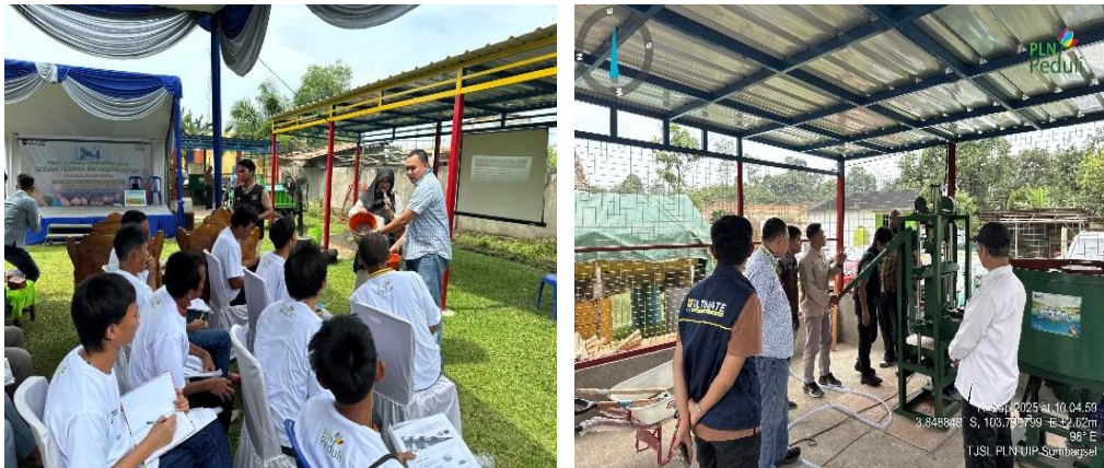
Gambar 6. Penjelasan bahan dasar dan cara pembuatan paving block FABA

Implementasi pelatihan pembuatan paving block berbasis FABA dilakukan melalui pendekatan praktis yang sistematis dan bertahap. Kegiatan ini dihadiri oleh 50 pemangku kepentingan, yang mencakup perangkat pemerintah desa, para stakeholder terkait, serta elemen masyarakat setempat. Dari total kehadiran tersebut, sebanyak 30 warga Desa Penyandingan berpartisipasi secara aktif sebagai peserta inti dalam proses produksi ( https://palpres.bacakoran.co/ ).