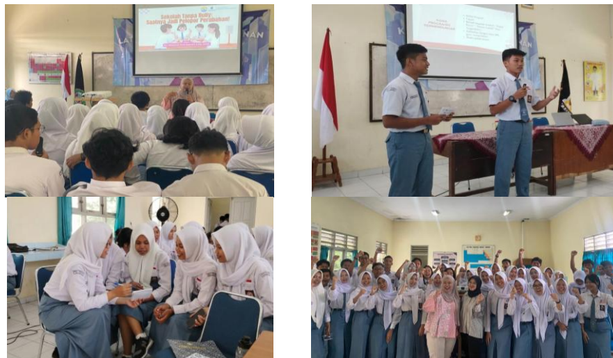
Gambar 1. Dokumentasi kegiatan penyuluhan, pelatihan, dan workshop

Pada tahap ini difokuskan pada kegiatan penyuluhan, pelatihan, dan workshop. Tahap penyuluhan memberikan pemahaman konseptual tentang bullying , kesehatan mental, dan peran OSIS sebagai agen perubahan. Peserta menunjukkan pemahaman konsep dengan dapat mengidentifikasi kasus dan memberi respons yang lebih tepat dalam diskusi. Tahap pelatihan keterampilan dasar konseling sebaya mencakup keterampilan attending, empati, dan komunikasi efektif. Meskipun masih terdapat variasi kemampuan antarindividu, siswa mulai paham terkait keterampilan yang diajarkan. Tahap workshop berisi penyusunan draf program kerja, di mana peserta merancang draf program pencegahan bullying yang realistis dan kontekstual. Seluruh bidang dalam OSIS dapat membuat draf program OSIS yang adaptif seperti kampanye anti- bullying , pembentukan peer counselor , serta kegiatan sharing session kesehatan mental. Hasil ini berarti keterlibatan aktif peserta dalam pelaksanaan mendorong terbentuknya program yang kontekstual dan relevan dengan kebutuhan siswa di SMA Negeri 1 Ngemplak.