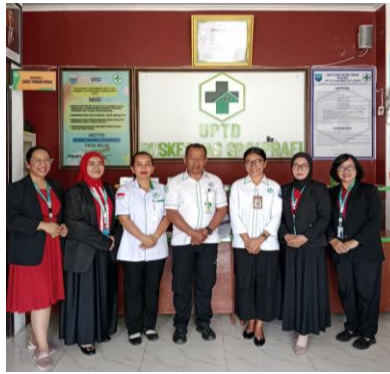
Gambar 2. Foto Pertemuan Dengan Kepala Puskesmas

Kegiatan pengabdian dimulai dari tahap persiapan. Kegiatan pada tahap ini kami berkoordinasi dengan Kepala Puskesmas Prafi SP 4. Dalam pertemuan ini membicarakan tentang masalah yang ditemukan, solusi, kegiatan yang akan dilakukan, tempat, waktu, dan petugas. Pertemuan dihadiri oleh Kepala Puskesmas, Bidan koordinator dan tim pengabdian. Hasil pertemuan didapatkan kesepakatan bahwa solusi dari masalah akan dilakukan edukasi kepada ibu-ibu di Posyandu Wasegi Indah, waktu kegiatan hari Sabtu, tanggal 14 Februari 2026 bertempat di Posyandu Wasegi Indah, dengan petugas tim pengabdian Bersama petugas dari Puskesmas.