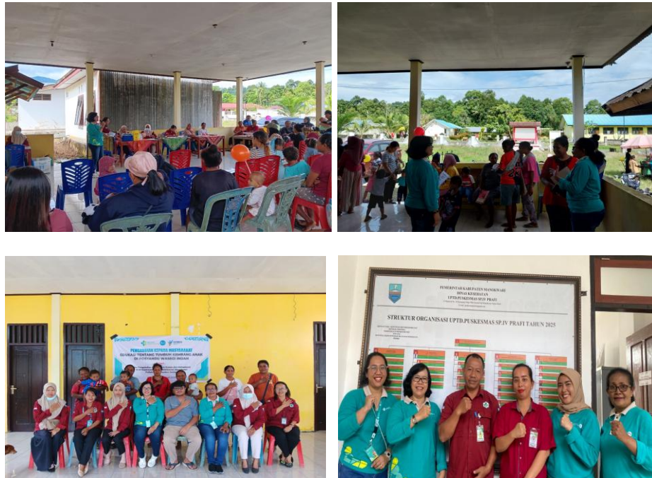
Gambar 3. Foto Kegiatan

dijawab 1 ibu dan dilengkapi oleh 2 orang ibu. Dari hasil evaluasi ini menunjukkan bahwa edukasi yang diberikan dapat meningkatkan pengetahuan ibu yang dilihat dari jumlah ibu yang bertanya dan menjawab lebih banyak dari pertanyaan awal. Pertanyaan di awal hanya dijawab oleh 2 ibu, sedang pertanyaan diakhir dijawab oleh 7 ibu, ada perbedaan 5 orang.