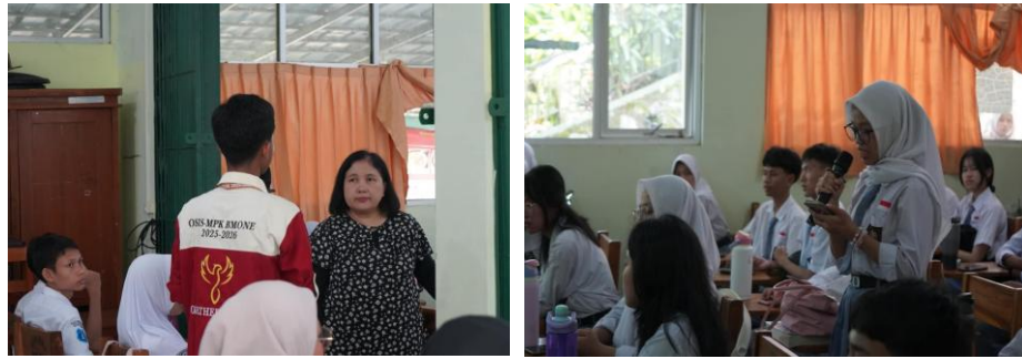
Gambar 3. Proses tanya jawab oleh siswa SMAN 1 Babakan Madang