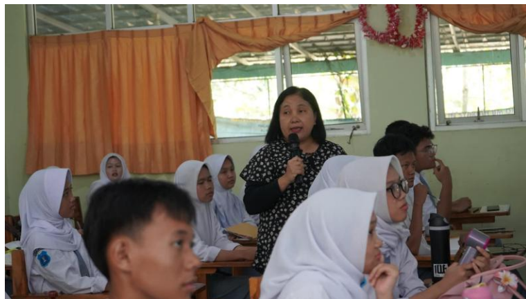
Gambar 2. Pemberian materi edukasi klinis oleh dokter spesialis kepada siswa SMAN 1 Babakan Madang

Untuk membuktikan bahwa peningkatan tersebut signifikan, dilakukan uji Paired T-test. Hasil uji statistik menunjukkan nilai p = 0,000 ( p < 0,05 ). Hal ini membuktikan secara nyata bahwa program edukasi klinis yang disampaikan oleh narasumber dokter spesialis efektif secara signifikan dalam meningkatkan literasi pencegahan kekerasan seksual pada siswa SMA Negeri 1 Babakan Madang.