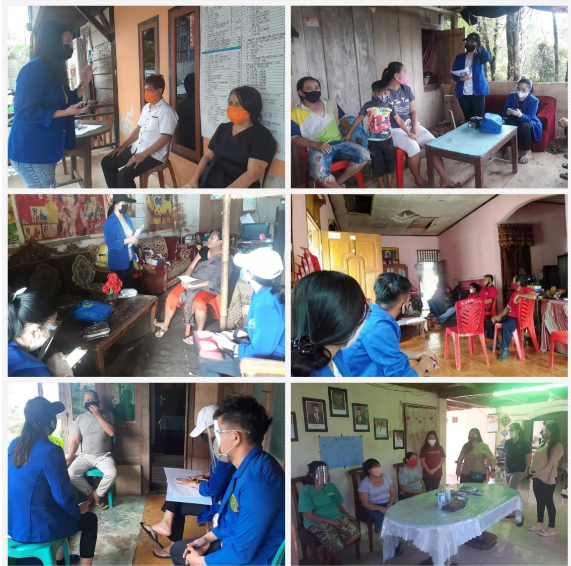
Gambar 2.2 Pelaksanaan Kegiatan PKM