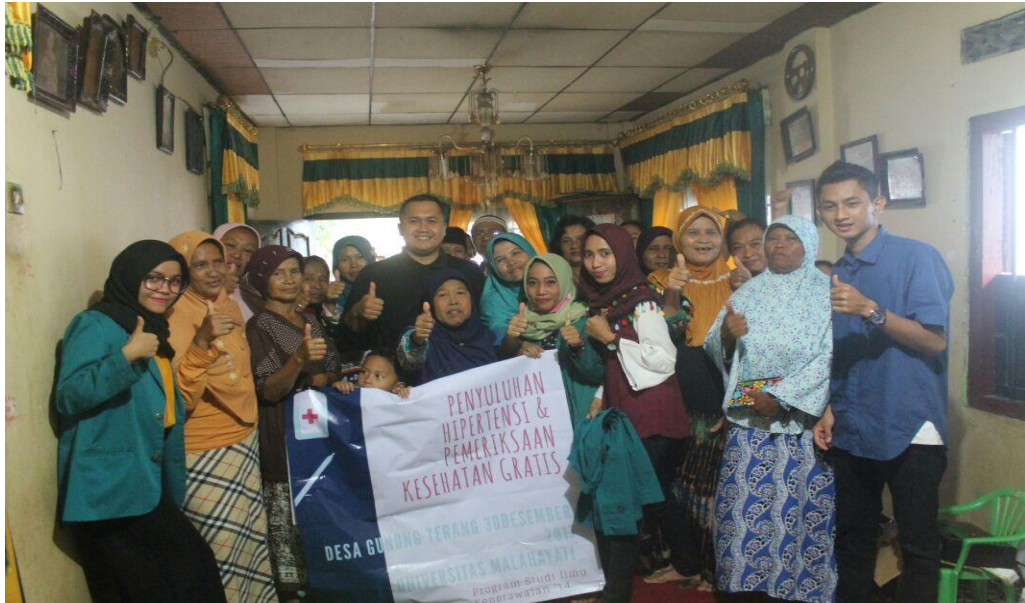
Gambar 4.1. Penyuluhan tentang Pencegahan dan pengobatan Hipertensi

Penyuluhan tentang Pencegahan dan pengobatan Penyakit Hipertensi di wilayah kerja Puskesmas Kemiling berjalan dengan lancar. Peserta yang hadir sekitar 30 Bapa dan Ibu serta paralansia yang berada dilingkungan tersebut. Berikut gambar pelaksanaan penyuluhan: