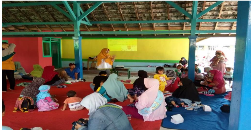
Gambar 4.1 Kegiatan Penyuluhan Perkembangan Psikososial Anak

Stimulasi perkembangan psikososial bayi (0 - 18 bulan). Bayi merupakan tahap awal dalam mengembangkan rasa percaya dengan orang tua. Ciri perkembangan bayi yang normal adalah bayi tidak langsung menangis saat bertemu orang lain, Menolak saat akan di gendong orang yang tidak dikenal, Menangis jika basah, lapar, haus, sakit, dan gerah, Senang ketika ibu datang menghampiri, Menangis ketika ditinggalkan oleh ibu, dan Memandang wajah ibu.