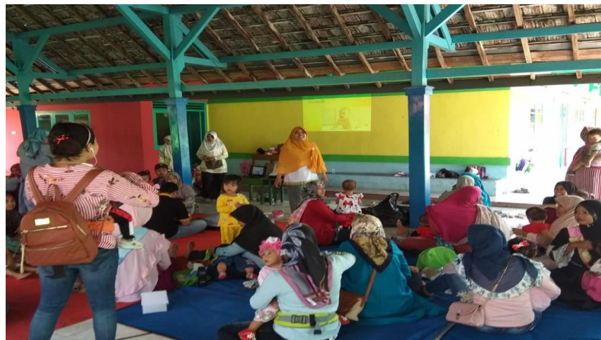
Gambar 4.2 Kegiatan Penyuluhan Perkembangan Psikososial Anak

Stimulasi perkembangan psikososial bayi (0 - 18 bulan). Bayi merupakan tahap awal dalam mengembangkan rasa percaya dengan orang tua. Ciri perkembangan bayi yang normal adalah bayi tidak langsung menangis saat bertemu orang lain, Menolak saat akan di gendong orang yang tidak dikenal, Menangis jika basah, lapar, haus, sakit, dan gerah, Senang ketika ibu datang menghampiri, Menangis ketika ditinggalkan oleh ibu, dan Memandang wajah ibu.