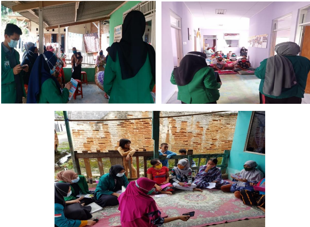
Gambar 4.1 Pelaksanaan Kegiatan Penyuluhan

Dari 12 ibu hamil yang diberikan materi tentang perilaku ibu hamil pada trimester III dan persiapan untuk persalinan. Terdapat 8 ibu hamil yang mengatakan belum mengetahui persiapan persalinan serta perencanaan-perencanaan untuk persalinan. Ibu hamil yang mengatakan hal tersebut, narasumber menyarankan untuk mulai merencanakan persalinan dengan pihak puskesmas dan menginformasikan kepada ibu hamil apa saja yang harus di persiapkan oleh ibu hamil dan keluarga untuk menghadapi persalinan serta perilaku yang baik pada ibu hamil trimester III untuk mempermudah persalinan. Semua ibu hamil yang hadir diberikan penyuluhan terkait perilaku ibu hamil di