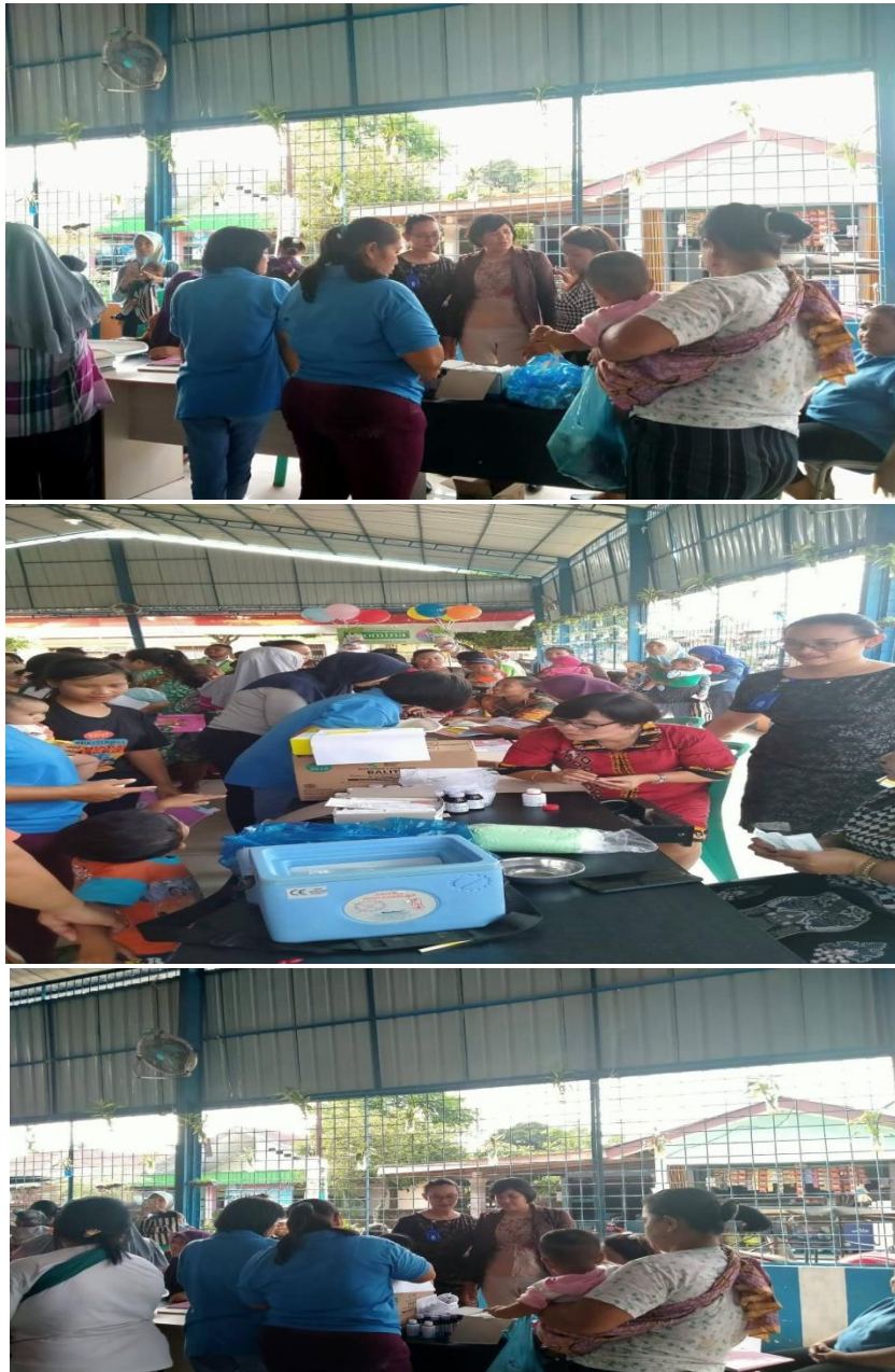
Gambar 4.1 Pelaksanaan Pengabdian Kepada Masyarakat