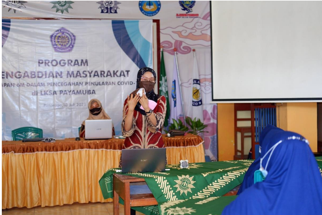
Gambar 5. Pelatihan Cuci Tangan dan Pengelolaan Sampah Masker Sekali Pakai