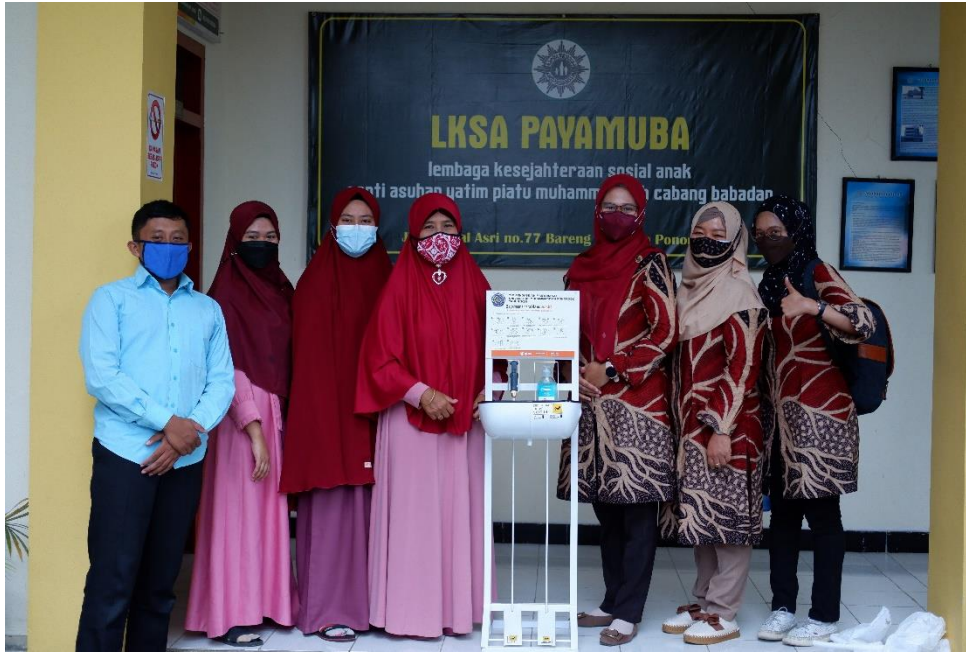
Gambar 7. Penyerahan Sarana Cuci Tangan