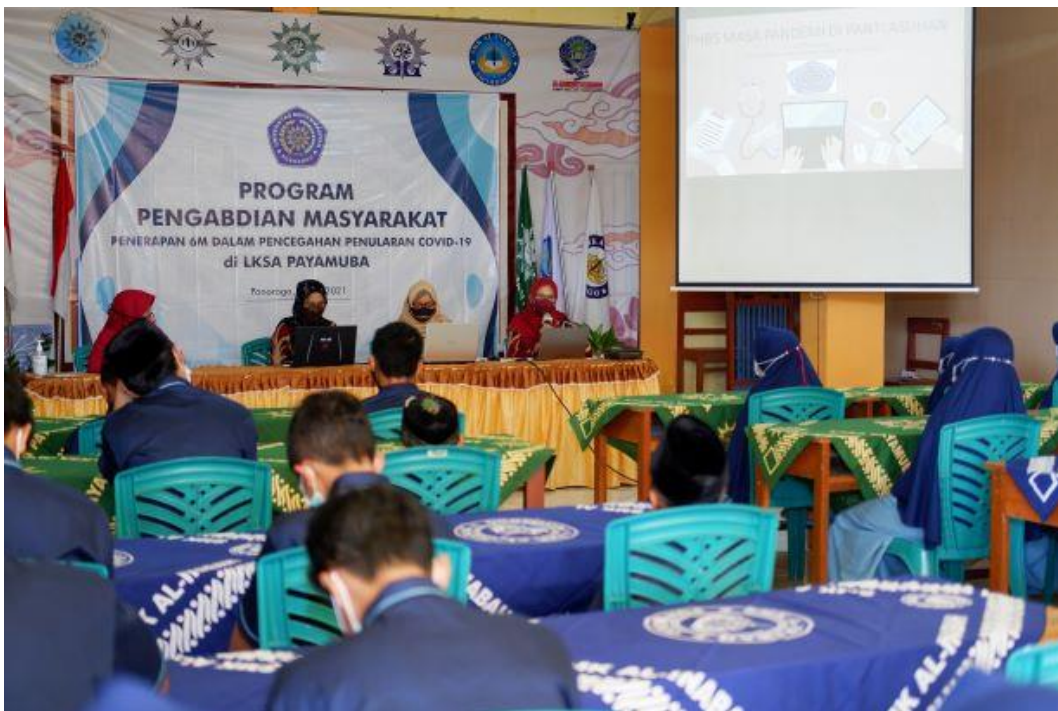
Gambar 4. Penyampaian Materi 3 tentang PHBS Masa Pandemi di Panti Asuhan