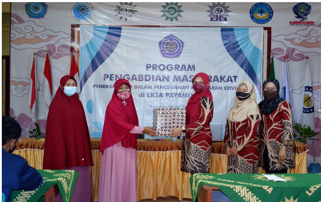
Gambar 6. Penyerahan Bahan Cuci Tangan dan Masker