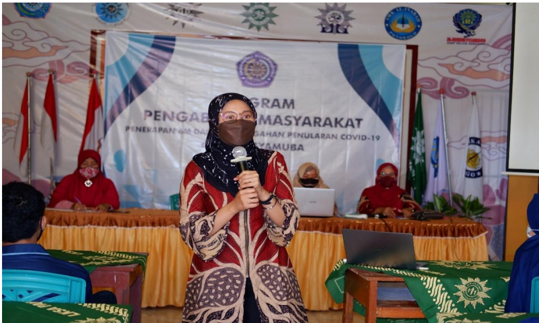
Gambar 3. Penyampaian Materi 2 tentang Penerapan 6M dalam pencegahan Covid 19