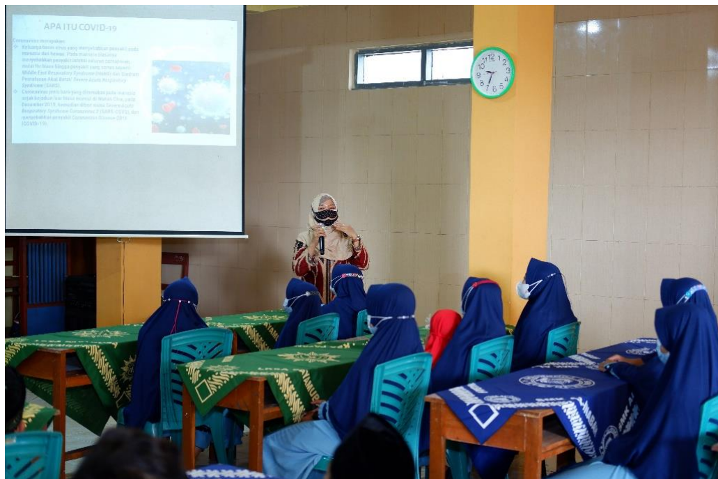
Gambar 2. Penyampaian Materi 1 Tentang Covid