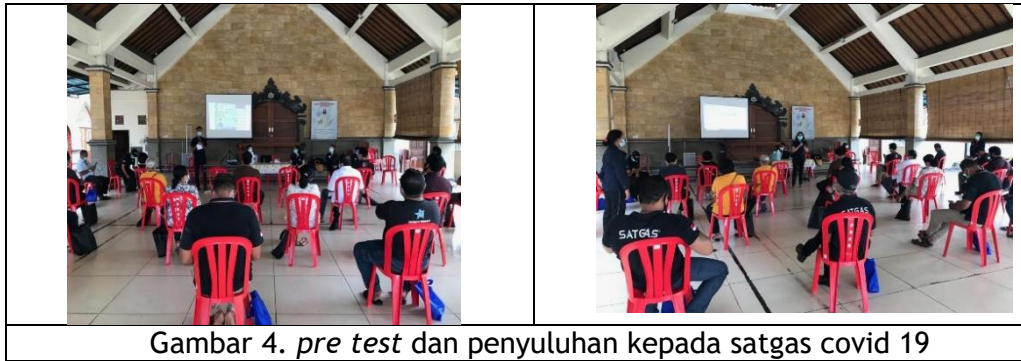
Gambar 4. pre test dan penyuluhan kepada satgas covid 19

Pertemuan Ketiga Minggu 7 Pebruari 2021 Dengan Agenda melakukan pelatihan praktik 5 M (mencuci tangan 6 langkah, demonstrasi menggunakan masker dengan baik dan benar, serta mengajarkan cara menjaga jarak, menghindari krumunan dan mengurangi mobilitas)