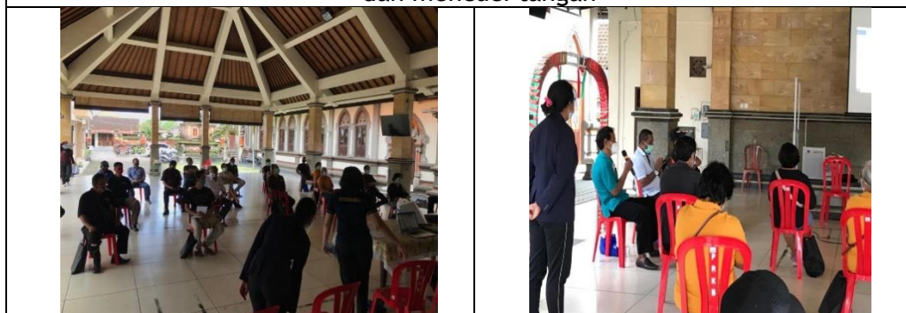
Gambar 3. Kegiatan perkenalan sambutan