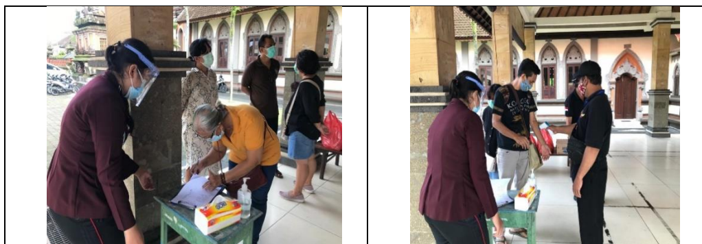
Gambar 2. Kegiatan registrasi peserta dengan pengecekan suhu tubuh dan mencuci tangan

Pertemuan kedua dimulai pukul 10.00 WITA, Ketika peserta datang maka dilakukan pengecekan suhu tubuh, absensi, mencuci tangan dengan air mengalir dan hand sanitizer dan mengganti masker peserta dengan masker bedah serta memberikan face shield kepada peserta untuk pencegahan penularan covid 19. Selanjutnya, kegiatan yang dilakukan adalah pre test , selanjutnya kegiatan dilanjutkan dengan penyuluhan tentang covid 19 dan penularan covid 19 di Indonesia dengan total jumlah peserta sebanyak 19 peserta yang terdiri dari 5 perempuan dan 14 laki-laki. Kegiatan diawali dengan pemberian pre test kepada peserta tersebut. Pre test diberikan untuk mengukur pengetahuan awal peserta dalam memahami tentang covid 19. Soal pre test berupa pertanyaan objective sebanyak 10 Pernyataan.