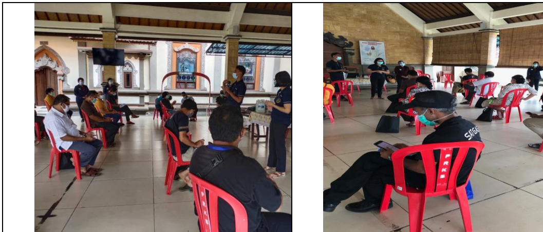
Gambar 6. Kegiatan post test

Data pre test dan post test dianalisis dengan menggunakan analisis Wilcoxon . Penggunaan Wilcoxon digunakan karena distribusi nilai pre test dan post test tidak normal, dan diperoleh nilai signifikan < 0,05 . Hal ini menunjukkan bahwa pemberian penyuluhan dan pelatihan tentang 5M berpengaruh signifikan terhadap tingkat pengetahuan peserta. Hal ini terlihat dari hasil uji statistik nilai pre test dan post test diperoleh rata-rata nilai pre test 91.70 dan post test 100. Dimana nilai post test lebih besar daripada pre test yang bermakna peningkatan pengetahuan dan kemampuan peserta setelah diberikan penyuluhan dan pelatihan 5M.