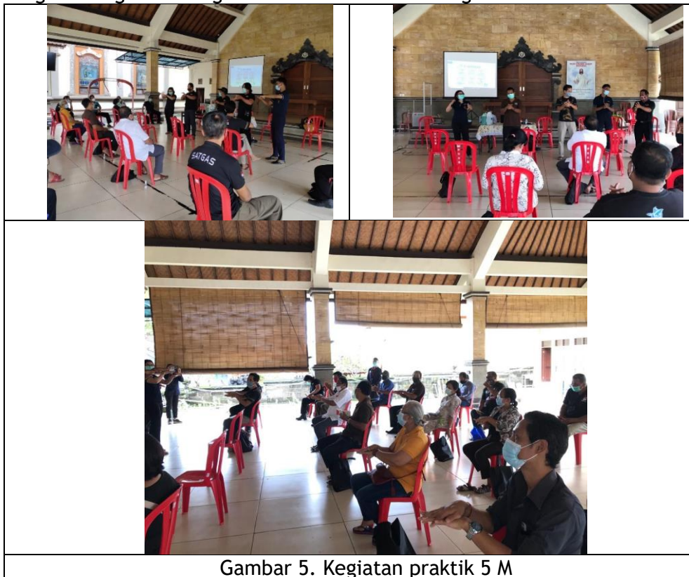
Gambar 5. Kegiatan praktik 5 M

Pertemuan ketiga dimulai pukul 10.00 WITA, Ketika peserta datang maka dilakukan pengecekan suhu tubuh, absensi, mencuci tangan dengan air mengalir dan hand sanitizer dan mengganti masker peserta dengan masker bedah serta memberikan face shield kepada peserta untuk pencegah penularan covid 19, selanjutnya kegiatan yang dilakukan adalah praktik demonstrasi mencuci tangan dengan 6 langkah dan demonstrasi menggunakan masker dengan benar yaitu menutupi hidung dan mulut dan cara membuang masker di tempat sampah. Kegiatan ini berjalan dengan baik dan peserta mengikuti kegiatan dengan antusias dan bersemangat.