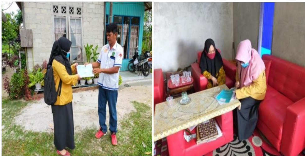
Gambar 5. Penyerahan Buku Tabungan Bank Sampah pada Unit Anggrek Unit Pamulang di Kelurahan Gunung Seteleng

Dari sosialisasi tersebut diketahui bahwa kegiatan tersebut tidak menyediakan buku tabungan bagi unit bank sampah yang akan dibentuk sehingga pembuatan buku tabungan tersebut sangatlah penting demi berjalannya unit bank sampah di kedua RT tersebut. Hasil yang diperoleh dari kegiatan pembuatan buku tabungan bank sampah yaitu pencetakan buku tabungan itu sendiri yang berguna untuk membantu memudahkan masyarakat setempat untuk melakukan transaksi sampah yang akan di setor kepada titik pengempulan yang telah disediakan dan hasil daripada itu guna dapat pelaporan secara tertulis sehingga tidak perlu lagi membuat arsip pribadi untuk menabung di bank sampah yang telah dibuat.