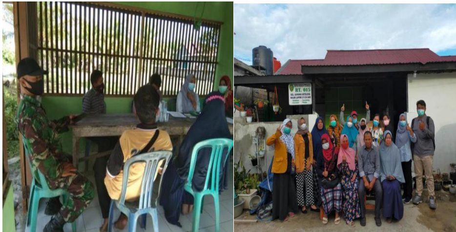
Gambar 4. Kegiatan Sosialisasi dan Pembuatan Unit Bank Sampah di RT.010 dan RT.015 di Kelurahan Gunung Seteleng

Dari sosialisasi tersebut diketahui bahwa kegiatan tersebut tidak menyediakan buku tabungan bagi unit bank sampah yang akan dibentuk sehingga pembuatan buku tabungan tersebut sangatlah penting demi berjalannya unit bank sampah di kedua RT tersebut. Hasil yang diperoleh dari kegiatan pembuatan buku tabungan bank sampah yaitu pencetakan buku tabungan itu sendiri yang berguna untuk membantu memudahkan masyarakat setempat untuk melakukan transaksi sampah yang akan di setor kepada titik pengempulan yang telah disediakan dan hasil daripada itu guna dapat pelaporan secara tertulis sehingga tidak perlu lagi membuat arsip pribadi untuk menabung di bank sampah yang telah dibuat.