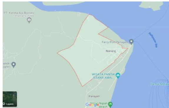
Gambar 1. Lokasi pengabdian masyarakat Kelurahan Gunung Seteleng