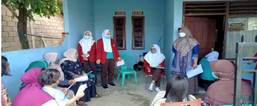
Gambar 4.1. Tahap Pelaksanaan pemberian Pendidikan Kesehatan dan Pemberian Leaflet