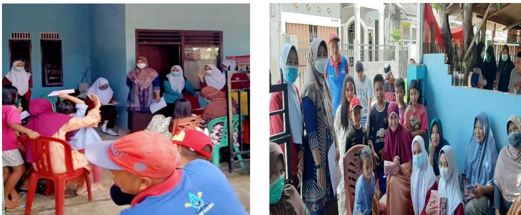
Gambar 4.2 Tahap Evaluasi memberikan pertanyaan kepada warga