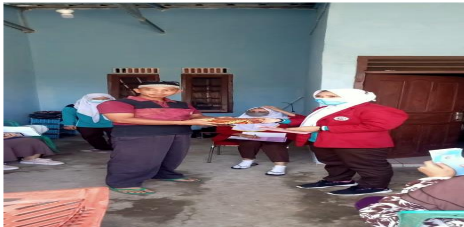
Gambar 4.3 Pemberian Doorprice bagi masyarakat yang dapat menjawab pertanyaan.