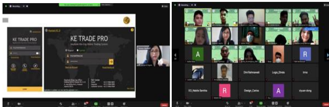
Gambar 3. Pelaksanaan training

Pelaksanaan training menggunakan materi yang berbeda dan lebih diarahkan ke praktek melakukan investasi, judul materi yang diberikan yaitu " Step-by-Step How to Invest in Stock Market". Pada saat training peserta diajarkan langkah-demi langkah dalam berinvestasi, dimulai dengan pembukaan rekening untuk investasi, sampai ke membaca trend pasar. Training dilaksanakan pada tanggal 18 Juli 2021, berlangsung dari jam 9.000-12.00 dengan pembicara yang sama. Jumlah peserta juga sama yaitu 80 orang. Antusiasme peserta terlihat ketika melakukan tanya jawab, rasa penasaran dan keingintahuan para generasi Z sangat besar di dalam berinvestasi (Saputra, 2019). Ciri khas dari generasi Z ini juga ditemukan pada pelaksanaan PKM dengan thema yang sama (Rahmawati, 2021). Acara ditutup dengan pengisian daftar hadir dan feedback melalui link yang disediakan panitia.