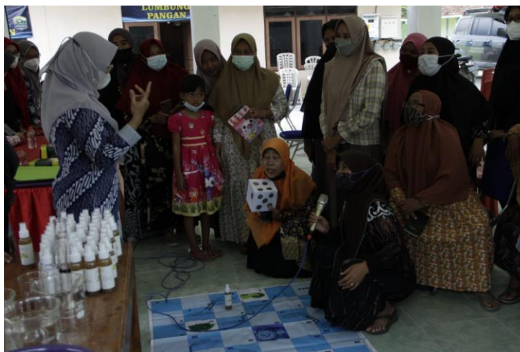
Gambar 2. Evaluasi Pemahaman Mitra dengan Metode Games Ular Tangga

Setelah memberikan edukasi tentang pemanfaatan daun sirih dan jeruk nipis sebagai bahan baku pembuatan hand sanitizer , mitra diberi pelatihan pembuatan hand sanitizer . Pada tahap ini, mitra diminta untuk mempraktekkan pembuatan hand sanitizer yang berbahan baku daun sirih dan jeruk nipis. Mitra dibagi menjadi 5 kelompok, dimana setiap kelompok didampingi oleh 1 tim pengabdian. Tim melakukan penilaian kemampuan mitra dalam membuat