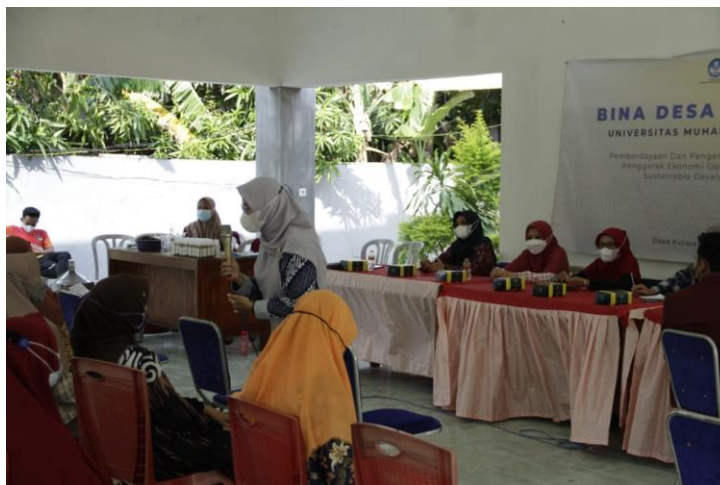
Gambar 1. Edukasi Masyarakat tentang Pembuatan Hand Sanitizer Ekstrak Daun Sirih

yang dibuat ini tidak akan menimbulkan kulit kering dan iritasi karena dibuat dari bahan yang alami. Pemahaman mitra tentang pemanfaatan daun sirih sebagai hand sanitizer alami di evaluasi dengan metode games ular tangga (Gambar 2).