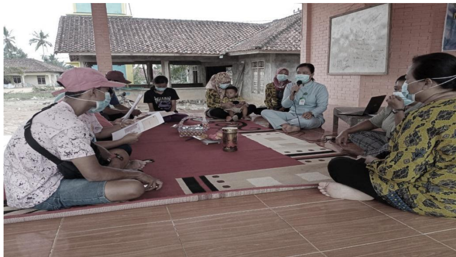
Gambar 2. Foto kegiatan Pengabdian Kepada Masyarakat

Saat pretest tim mendapatkan nilai rata-rata pengetahuan calon pengantin tentang imunisasi TT adalah sebanyak 35%. Tim melakukan peninjauan dan didapatkan hampir seluruhnya memiliki pengetahuan sebatas definisi. Materi yang disampaikan meliputi definisi, manfaat, jadwal dan tempat serta dampak jika tidak dilakukan imunisasi. Tim memberikan kesempatan kepada peserta yang belum faham untuk mengajukan beberapa pertanyaan. Diakhir materi tim memberikan penegasan kepada calon pengantin untuk segera melakukan imunisasi TT sebagai upaya pencegahan penyakit tetanus. Kegiatan ditutup dengan melakukan post test dengan memberikan beberapa pertanyaan yang sama dengan pertanyaan saat pretest dan didapatkan 95% calon pengantin mengeti dan faham tentang imunisasi TT. Edukasi merupakan cara yang efektif untuk meningkatkan pengetahuan dan pemahaman masyarakat tentang kesehatan. Hal tersebut terbukti dengan meningkatkan pengetahuan calon pengantin saat post test dengan selisih nilai sebanyak 60%.