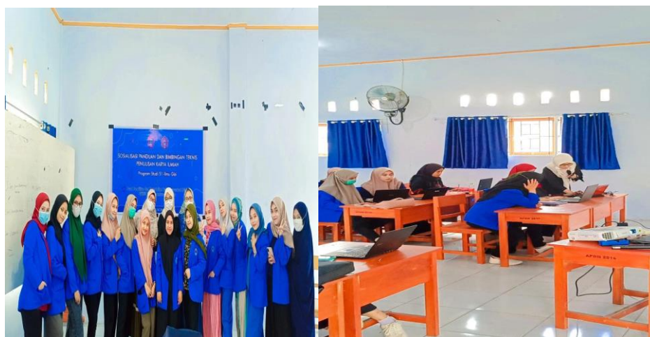
Gambar 2 Kegiatan Pelatihan Mendeley

Sosialisasi atau pelatihan Mendeley ini dilakukan guna memberikan pemahaman mahasiswa dalam mengelola daftar referensi, mencari sumber referensi maupun memperluas jejaring akademisi. Selain materi yang disampaikan pada pelatihan ini juga diberikan praktik untuk mempermudah mahasiswa dalam pengelolaan software Mendeley.