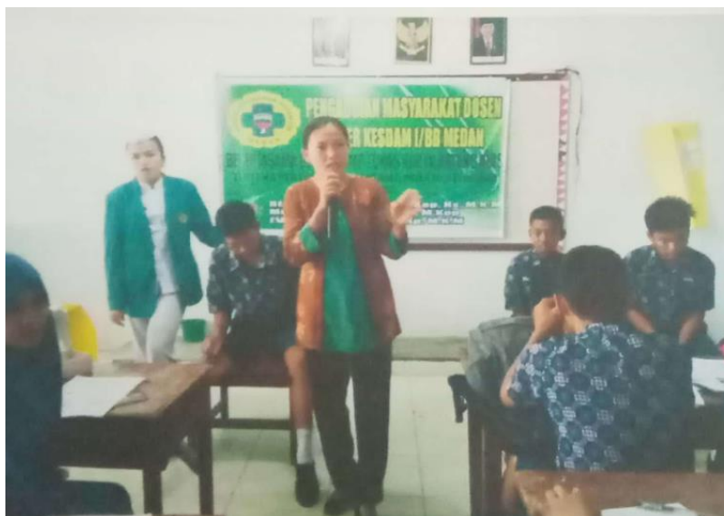
Gambar 3. Kegiatan praktek Pertolongan Pertama Kepada Kecelakaan (P3K) kepada siswa/siswi SMP Tuna Karya