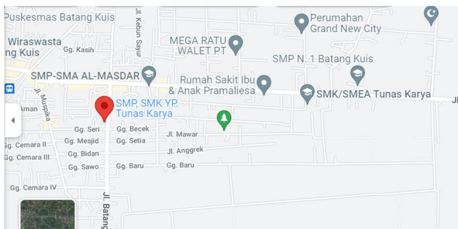
Gambar 1. Peta Lokasi Kegiatan Pengabdian Masyarakat di SMP Tunas Karya Batang Kuis

Salah satu tindakan/upaya promotif dalam mencegah terjadinya kesalahan dalam menolong korban kecelakaan akibat kurangnya pengetahuan tentang pertolongan pertama pada kecelakaan (P3K) maka diperlukan peran serta sekolah dan guru dalam membantu memberikan edukasi untuk meningkatkan pengetahuan siswa/siswi kelas IX. Pengabdian kepada masyarakat merupakan suatu media untuk menjembatani dunia pendidikan dengan masyarakat, dimana Perguruan Tinggi diwajibkan untuk melaksanakan tridarma perguruan tinggi salah satu diantaranya adalah melakukan pengabdian kepada masyarakat. Saat ini di SMP Tunas Karya Batang Kuis diadakan bakti sosial mengajak Akper untuk kerjasama dalam rangka kegiatan penyuluhan kesehatan tentang pertolongan pertama pada kecelakaan ( first aid ) pada sebagai dosen kami ikut dalam pelaksanaan dan memberi penyuluhan kesehatan tentang pertolongan pertama pada kecelakaan ( first aid ) pada siswa kelas IX yang lokasinya di SMP Tunas Karya Batang Kuis kelas IX Usia yang dilakukan edukasi tentang pertolongan pertama pada kecelakaan ( first aid ) adalah usia 14-15 tahun. Selesai penyuluhan kesehatan tentang pertolongan pertama pada kecelakaan ( first aid ) maka akan dilakukan praktik pertolongan pertama pada kecelakaan pada siswa tersebut.