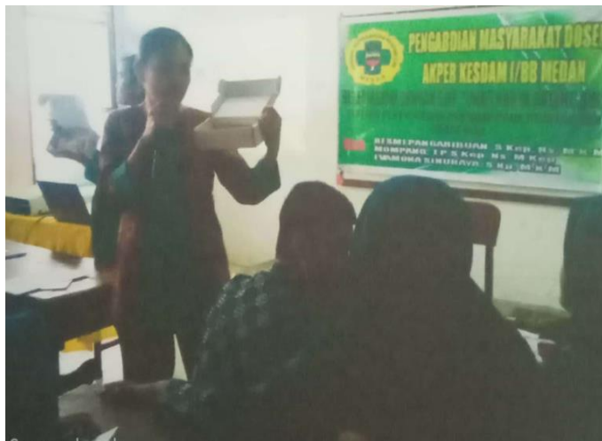
Gambar 2. Kegiatan penjelasan alat-alat Pertolongan Pertama Kepada Kecelakaan (P3K)