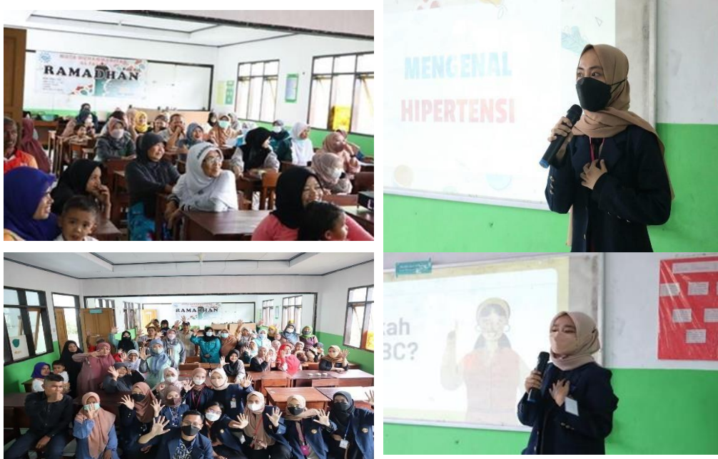
Gambar 2. Pelaksanaan Kegiatan

Kesehatan dilaksanakan pada :Hari/ tanggal : Minggu, 15 Mei 2022 Pukul : 10.53 - 11.13 WIB. Tempat/Lokasi Pelaksanaan dilaksanakan di Madrasah TPA Al Falah. Kegiatan sosialisasi dan edukasi tentang upaya peningkatan kewaspadaan terhadap serangan stroke pada penderita hipertensi di rw 05 dan 06 Sukamentri Garut, dihadiri oleh 55 orang yang merupakan warga rw 05 dan 06 kelurahan Sukamentri, ditambah 5 orang kader kesehatan dan 1 orang Pembina wilayah dari Puskesmas. Aktifitas ini melibatkan 11 orang mahasiswa profesi stase komunitas dari Fakultas Keperawatan Universitas Padjadjaran. Mayoritas para peserta berusia antara 18 tahun sampai dengan 57 tahun dimana responden yang berusia 18-35 sebanyak 43%, dan responden yang berusia 36-57 tahun sebanyak 57%. Data responden berdasarkan jenis kelamin diperoleh data 68% mayoritas adalah perempuan dan 32% responden adalah laki-laki. Berikut gambar ketika penyuluhan dilaksanakan.