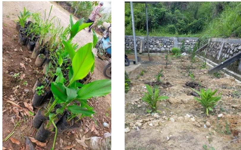
Gambar 2 Pemanfaatan Pekarangan dengan menanam TOGA