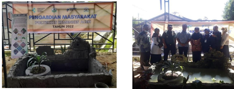
Gambar 3. Pembuatan Kolam Mini dan Tabur Benih Ikan