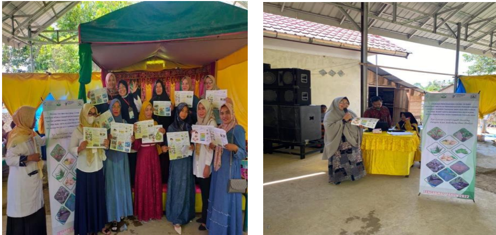
Gambar 1. Edukasi/penyuluhan Pencegahan COVID-19 Dan Stunting

dapat terpenuhi. Manfaat lain yang diperoleh dari kegiatan ini adalah berkurangnya pengeluaran sekaligus penambahan pendapatan keluarga jika hasil yang diperoleh telah melebihi kebutuhan pangan keluarga. Berkebun di lahan pekarangan memiliki peran penting dalam menjamin ketahanan pangan dan gizi selama pandemi Covid-19. Dengan berkebun di rumah, dapat memperkuat penyediaan berbagai jasa ekosistem, seperti keanekaragaman hayati tumbuhan, iklim mikro, limpasan air, kualitas air, dan kesehatan manusia (Swardana 2020)