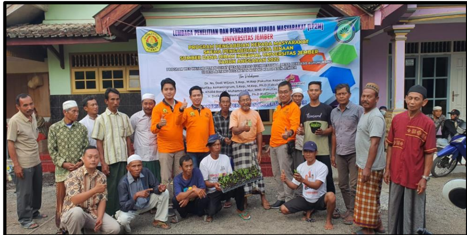
Gambar 5. Kader Petani Sehat (PESAT) di Desa Mayang Kecamatan Mayang Kabupaten Jember. Tanggal 25 September 2022