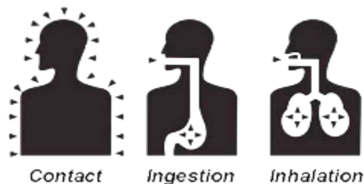
Gambar 2. Tiga Rute Utama Penyebaran Pestisida ke Dalam Tubuh Manusia (Mutia & Oktarlina, 2020).

Pestisida yang mengkontaminasi lingkungan biasanya berasal dari tumpahan pestisida, air cucian dari tempat pembersihan pestisida, kebocoran pestisida dari tempat penyimpanan, dan pembuangan pestisida yang tidak benar. Selain itu pencemaran pestisida juga bisa berasal dari hanyutnya pestisida ke saluran air, pestisida yang terbawa udara hingga perpindahan pestisida dari air bawah tanah (Tiryaki & Temur, 2010). Penyebaran pestisida di lingkungan pada tubuh manusia umumnya dapat masuk melalui 3 (tiga) rute, diantaranya melalui kontak (kulit), menelan (mulut), dan inhalasi (paru-paru) sehingga pemilihan jenis pestisida dapat mempengaruhi penyebaran pestisida ke dalam tubuh manusia (Mutia & Oktarlina, 2020).