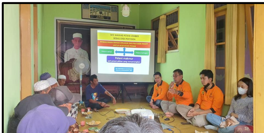
Gambar 4. Capacity Building Kader Petani Sehat (PESAT) di Desa Mayang Kecamatan Mayang Kabupaten Jember. Tanggal 25 September 2022.