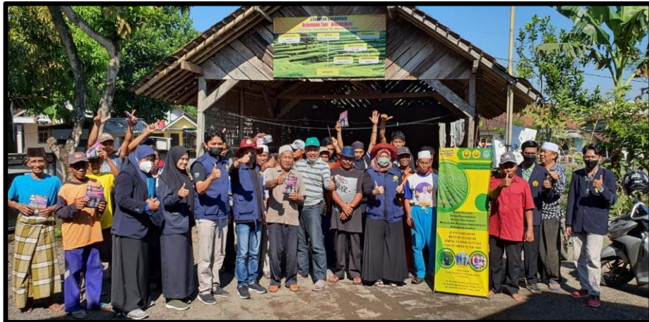
Gambar 3. Pembentukan Kader Petani Sehat (PESAT) di Desa Mayang Kecamatan Mayang Kabupaten Jember Tanggal 11 September 2022.

Program kegiatan pengabdian desa binaan berlangsung selama 1 (satu) bulan selama bulan September 2022 dengan melibatkan 50 peserta anggota kelompok tani. Partisipasi mitra dalam kegiatan ini sebagai peserta dan menghimpun partisipasi anggota kelompok tani untuk bersedia menjadi kader PESAT. Kehadiran peserta dalam kegiatan ini mencapai 100%. Adapun hasil kegiatan terinci sebagai berikut: