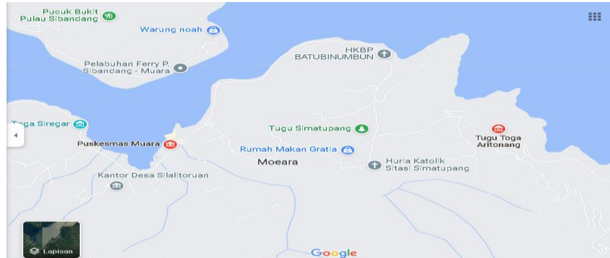
Gambar 1. Peta Lokasi Kegiatan

Puskesmas Muara terletak di kecamatan Muara Kabupaten Tapanuli Utara. Puskesmas ini dikenal baik oleh masyarakat yang ada disekitar maupun di luar daerah Kecamatan Muara dengan tingkat pelayanan yang dirasakan cukup baik oleh para pasien karena Bidan dan Perawat yang melayani terkenal baik dan ramah. Hasil wawancara awal dengan beberapa-beberapa wanita di wilayah kerja Puskesmas Muara yaitu Desa Aritonang menjelaskan bahwa sehari-harinya mereka pernah mengalami adanya pengeluaran cairan atau lendir dari alat genitalia nya apalagi menjelang masamenstruasi. Mereka tidak bisa memastikan apakah pengeluaran tersebut merupakan penyakit yang membahayakan atau tidak, perludiobatiatautidak ,ibu tersebut sudah melakukan IVA test dengan hasil tidak ada kelainan. Begitu juga dalam sehari-hari, mengatakan bahwa untuk menjaga kebersihan alat genitalianya hanya membersihkan saat mandi saja dengan menggunakan sabun mandi. Pakaian dalam juga diganti hanya saat mandi juga. Berdasarkan survey daun sirih banyak tumbuh disekitar desa Aritonang, yang mana sirih tersebut hanya digunakan untuk makan sirih bagi ibu yang sudah tua atau lansia. Berikut lokasi kegiatan;