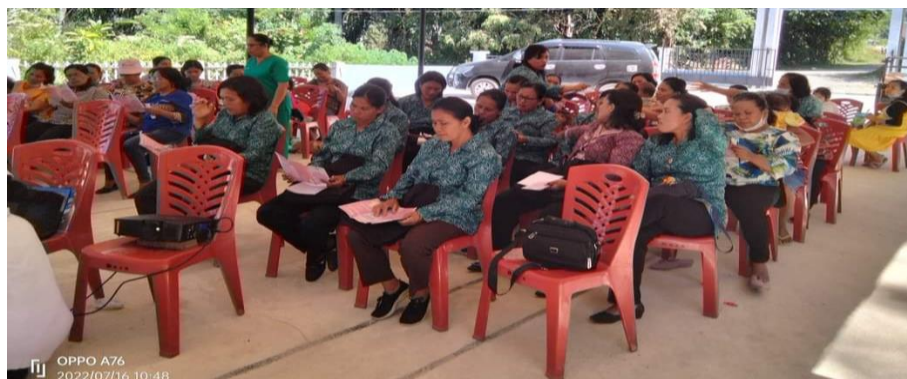
Gambar 3. Pelaksanaan Kegiatan