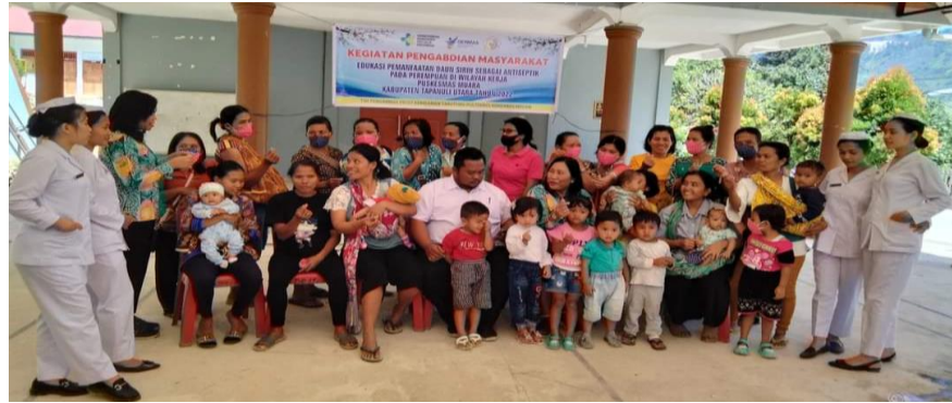
Gambar 4. Penutupan dan foto bersama

Berdasarkan pelaksanaan pengabdian kepada masyarakat “Edukasi Pemanfaatan Daun Sirih Sebagai Antiseptik Pada Perempuan di Wilayah Kerja Puskesmas Muara Kabupaten Tapanuli Utara” maka didapatkan hasil sebagai berikut: berdasarkan karakteristik umur, pendidikan terakhir, pekerjaan, dan anak ke- dengan hasil yaitu