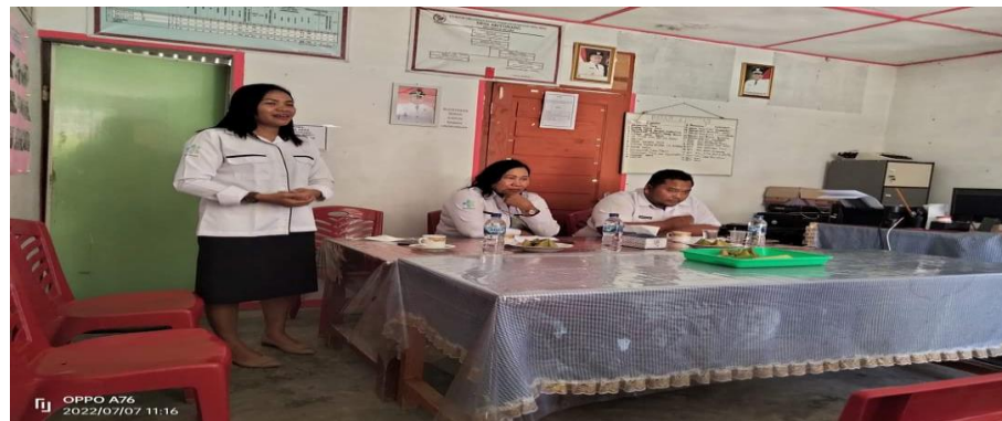
Gambar 2. Pembukaan Kegiatan

Pengabdian kepada masyarakat dilaksanakan di wilayah kerja Puskesmas Muara mulai tanggal 11 s/d 13 Mei 2021 dengan mengumpulkan perempuan di Desa Aritonang yang dihadiri oleh Kepala Desa Aritonang, bidan desa, perangkat Desa, Ibu-ibu PKK dan juga bidan yang ditugaskan Kepala Puskesmas untuk membantu pelaksanaan kegiatan pengabdian. Berikut foto hasil kegiatan;