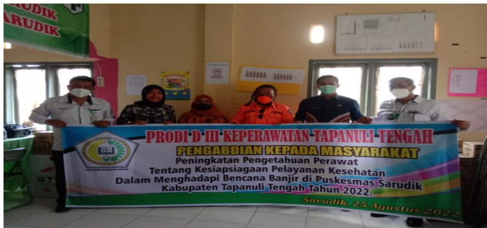
Gambar 2. Dokumentasi Kegiatan Pengabdian Kepada Masyarakat

pengetahuan peserta tentang kesiapsiagaan pelayanan kesehatan dalam menghadapi bencana banjir berada pada katagori pengetahuan baik sebanyak 36 orang (90%).