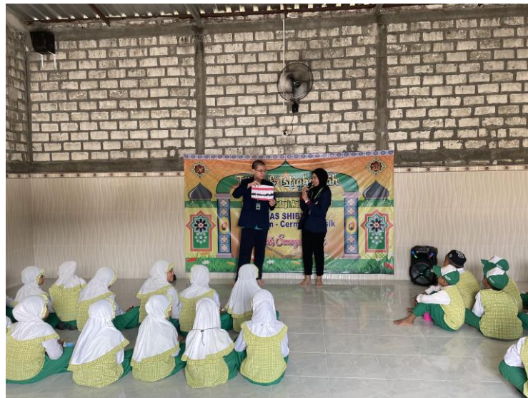
Gambar 2. Penyampaian edukasi cara menyikat gigi

Kegiatan kemudian dilanjutkan dengan pemberian kuis guna mengukur pengetahuan serta pemahaman peserta mengenai materi yang diberikan. Peserta kemudian diminta untuk mempraktekkan secara langsung mencuci tangan dan menyikat gigi yang benar di tempat yang telah disediakan sebagai implementasi dari ilmu yang telah didapatkan.