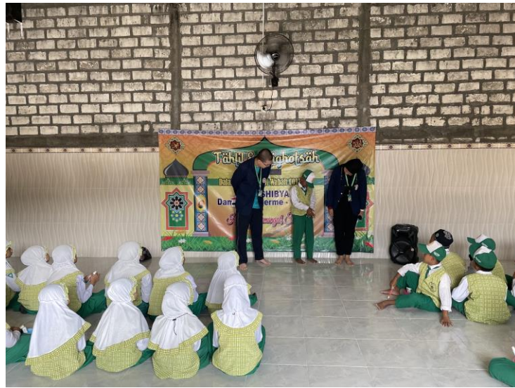
Gambar 4. Tanya jawab seputar materi sosialisasi

PHBS adalah salah satu program penting sebagai upaya peningkatan hidup sehat dalam sebuah masyarakat. Tidak hanya dibutuhkan kesadaran, pengaplikasian secara baik dan benar tentu memengaruhi aspek kesehatan dan kebersihan dalam diri individu. Kesadaran serta pengaplikasian ini dapat dimulai sejak individu berusia dini. Anak usia dini merupakan seorang anak yang usianya belum menginjak lembaga pendidikan formal yakni sekolah dasar, berkisar mulai dari 0 hingga 8 tahun. Anak usia dini umumnya tetap tinggal di rumah namun tetap mengikuti kegiatan dalam berbagai format mulai dari lembaga pendidikan pra-sekolah yakni PAUD, Taman Kanak-Kanak, taman bermain hingga taman penitipan anak. Sementara itu, masa 5 hingga 6 tahun adalah masa emas ( golden age ) yang hanya datang sekali sebagai masa peka seorang anak. Dalam masa-masa tersebut, diperlukan kondisi yang sesuai dengan kebutuhan individu anak agar pertumbuhan serta perkembangannya dapat dicapai dengan maksimal serta optimal. Pendidikan sebagai aspek penting dalam kehidupan individu usia dini dilaksanakan dengan berbagai cara mulai dari memberi contoh teladan, pemberian semangat, serta dorongan kepada individu anak untuk lebih berkembang (Julianti, et al, 2018).