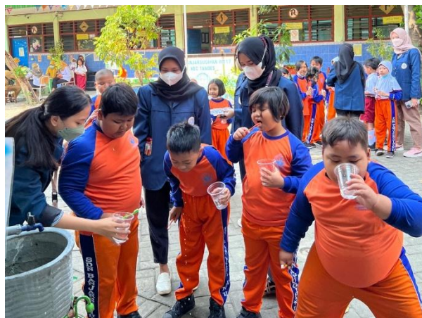
Gambar 3. Praktek Langsung Cara Menyikat Gigi