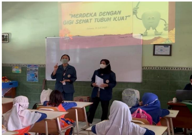
Gambar 2. Sosialisai Kesehatan Gigi Dan Mulut

Kegiatan pengabdian masyarakat berupa sosialisasi dan pemberian informasi mengenai kesehatan gigi dan mulut dan cara menyikat gigi dengan baik dan benar dengan menggunakan media visual serta sesi tanya jawab sebagai tolak ukur, pemahaman dan pengetahuan peserta terkait materi yang diberikan yang dilanjutkan dengan praktek langsung cara menyikat gigi dengan baik dan benar. Kegiatan sosialisasi ini berlangsung pada hari jumat, 22 Juli 2022 pukul 09.00-11.00, berlokasi di SDN Banjar Sugihan II. kegiatan ini dihadiri oleh kelas dua dengan total jumlah sekitar 27 siswa. Kegiatan dibuka dengan doa bersama yang dipimpin oleh pembawa acara. Yang dilanjutkan dengan materi menggunakan media visual dan poster mengenai sebab-akibat tidak menjaga kesehatan gigi dan mulut. Kemudian dilanjutkan sesi tanya jawab guna mengukur pengetahuan serta pemahaman peserta mengenai materi yang diberikan. Kegiatan selanjutnya pembagian kelompok dimana 1 kelompok berisi 5-6 siswa dan 1 pendamping serta mempraktekkan secara langsung cara menyikat gigi dengan baik dan benar sesuai materi yang diberikan pada saat di dalam kelas bersama pendamping.