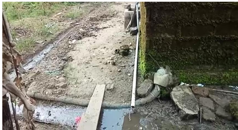
Gambar 1. Pembuangan limbah rumah tangga

Diare adalah penyakit endemis yang potensial wabah di Indonesia dan disertai kematian (Manikam et al., 2022; Puspitasari et al., 2015). Kementerian Kesehatan RI mencatat diare merupakan penyebab utama kematian balita usia 12-59 bulan, sedikitnya 314 kematian balita akibat diare terjadi di Indonesia pada 2019 (Jayani, 2021). Tahun 2021, 14,0% kematian bayi post neonatal (29 hari-11 bulan) dan 10% pada balita (12-59 bulan) disebabkan oleh diare (Kemenkes RI., 2022).