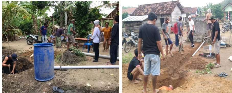
Gambar 4. Pembuatan SPAL dan jamban percontohan

Kegiatan pelatihan dilaksanakan pada tanggal 11 Juni 2022 juga bertempat di kediaman Kepala Kampung. Peserta kegiatan adalah masyarakat Kampung Swastika, terutama yang belum memiliki SPAL dan WC.