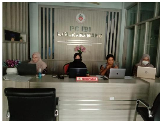
Gambar 2. Sosialisasi dan persamaan persepsi dengan para konselor PC IBI Karawang, pelaksanaan melalui daring dan luring

Untuk dapat mewujudkan program dengan baik maka pengabdian mengawalinya dengan sosialisasi kepada Pengurus Cabang Ikatan Bidan Indonesia dan para konselor tentang prototype aplikasi IBI karawang. Sosialisasi tersebut diharapkan dapat menyempurnakan dalam