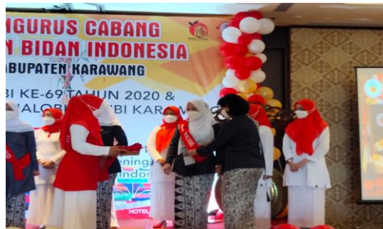
Gambar 5. Pengukuhan Konselor