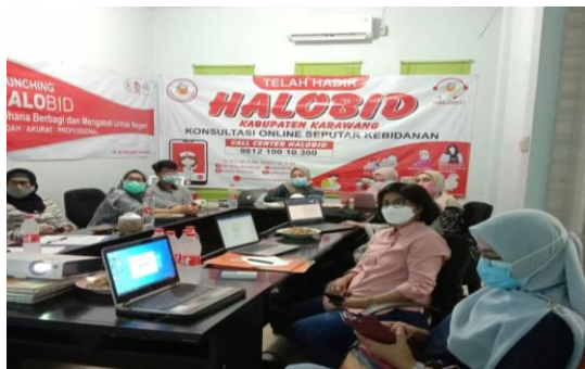
Gambar 3. Demonstrasi penggunaan aplikasi halobid karawang