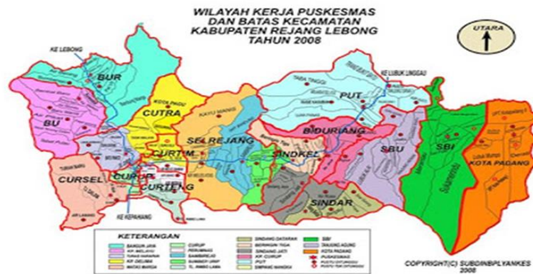
Gambar 1. Peta lokasi pelaksanaan pengabdian masyarakat