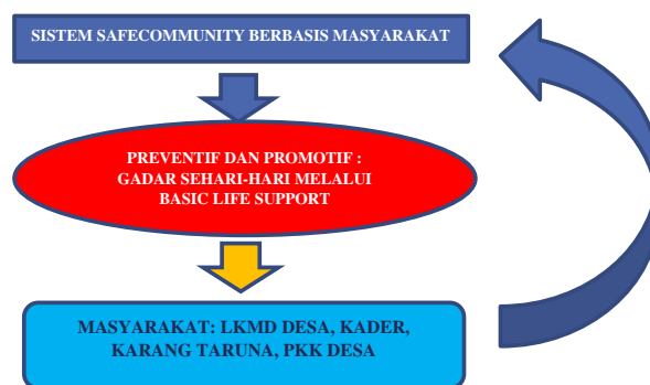
Gambar 2. Metode kegiatan pengabdian masyarakat

Kegiatan pengabdian masyarakat ini menggunakan metode ceramah untuk memberikan pengetahuan tentang penerapan Basic Life Support berbasis masyarakat. Sedangkan pelatihan dilaksanakan melalui demonstrasi untuk meningkatkan peserta dalam melakukan Basic Life Support . Pengabdian masyarakat yang dilakukan dalam pelatihan untuk meningkatkan pengetahuan dan keterampilan yang meliputi: Bantuan Hidup Dasar, Pertolongan Korban Tersedak, Pertolongan Kejang Demam, Pertolongan Digigit Serangga, Balut dan Bidai, Pertolongan Pada Luka Bakar. Peserta pada pelatihan terdiri dari tokoh masyarakat, Ibu PKK, Kader Kesehatan, dan Karang Taruna, yang berjumlah 40 peserta. Metode yang dipergunakan dalam kegiatan pengabdian masyarakat ini adalah: