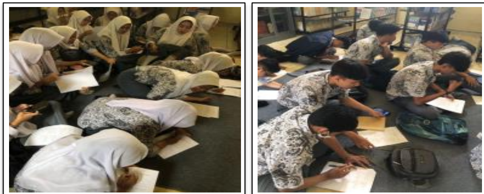
Gambar 3. Posttest dan Sesi Tanya Jawab

Kegiatan edukasi kesehatan ini dilaksanakan secara luring di SMA 1 Darul Falah Desa Cihampelas pada hari kamis tanggal 19 Januari 2023 dengan durasi sekitar 1 jam. Kegiatan diawali dengan pembukaan oleh MC, sambutan dari dosen, dan perwakilan tim pelaksana kerja selaku perwakilan. Sebelumnya, pretest telah dilaksanakan pada hari yang berbeda dengan kegiatan inti berkaitan dengan survey kebutuhan informasi terkait stunting dan upaya pencegahannya. Hasil survey awal melalui pretest menunjukkan bahwa peserta belum memiliki pengetahuan yang memadai terkait stunting dengan skor rata-rata pengetahuan belum mencapai batas minimum 75%. Menindaklanjuti hasil tersebut, tim pelaksana kerja memaparkan materi terkait stunting dan pencegahannya menggunakan media Power Point (PPT). Setelah pematerian selesai, kegiatan dilanjutkan dengan sesi tanya jawab dan diskusi bersama yang dipandu oleh MC. Seluruh peserta menunjukkan sikap antusias dan tertarik selama penyampaian materi dan sesi tanya jawab berlangsung. Pada sesi yang sama, tim pelaksana kerja membagikan lembar posttest yang dapat peserta isi langsung secara tertulis.