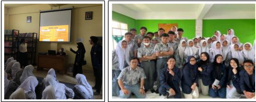
Gambar 2. Pretest dan Sesi Edukasi Stunting

kondisi balita normal dengan balita yang mengalami stunting atau gangguan kesehatan lainnya, kurangnya optimalisasi asupan gizi seimbang dan rendahnya upaya PBHS dapat disebabkan salah satunya oleh pengetahuan calon orangtua yang kurang. Maka dari itu, kegiatan edukasi stunting ini dilakukan dalam upaya meningkatkan pengetahuan siswa- siswi sebagai calon orangtua di masa mendatang.