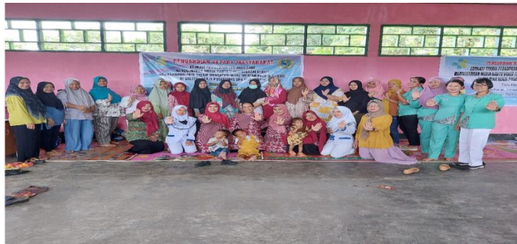
Gambar 3-4 Foto Kegiatan PKM