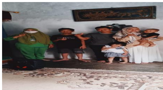
Gambar 5 Pendidikan Kesehatan Penanganan Tersedak

Selain itu lingkungan pekerjaan juga dapat menjadikan seseorang memperoleh pengalaman dan pengetahuan baik secara langsung maupun secara tidak langsung. Lingkungan yang ditempati oleh responden dapat menjadikan seseorang memperoleh pengalaman dan pengetahuan dengan cara berinteraksi dengan orang lain atau tetangga yang mempunyai pengetahuan baik, maka dapat dipastikan pengetahuan responden juga akan semakin bertambah baik. Menurut pendapat penulis penyuluhan yang diberikan selain penjelasan dan bagaimana cara menangani tersedak, peneliti juga memberikan alat peraga berupa edukasi video yang membantu responden untuk lebih mudah memahami isi dari penyuluhan karena isi dari edukasi video diberikan gambar-gambar tentang penanganan tersedak. Penyuluhan tidak lepas dari media karena melalui media, pesan disampaikan dengan mudah untuk dipahami. Media dapat menghindari kesalahan persepsi, memperjelas informasi, dan mempermudah pengertian.