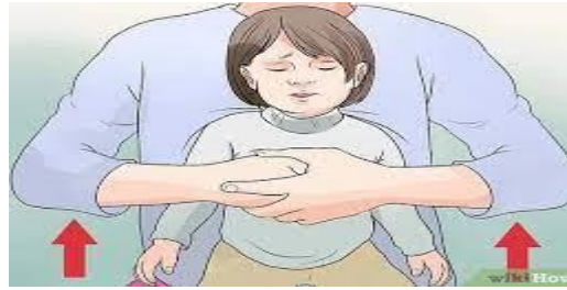
Gambar 3 Abdominal Trust