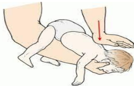
Gambar 2 Back Blow