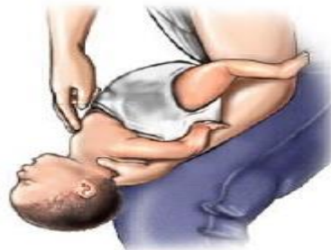
Gambar 4 Chest trust