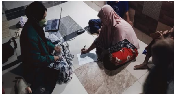
Gambar 7 Pengisian Kuesioner