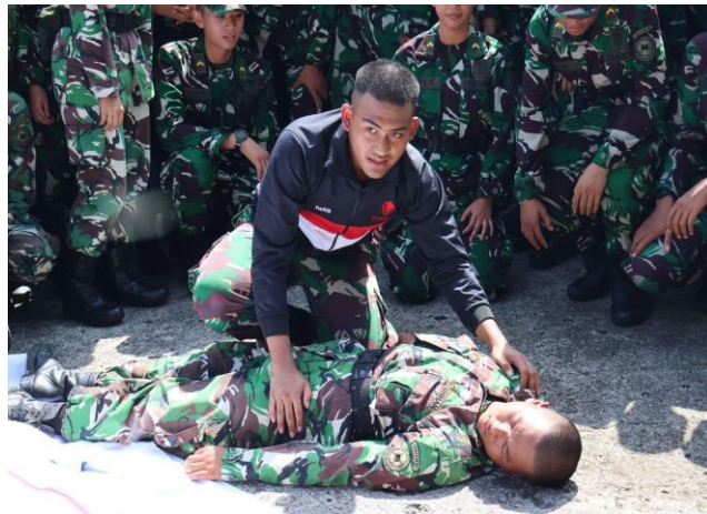
Gambar 2. Simulasi Dan Demonstrasi Penanganan Korban Bencana Oleh Perwakilan Dari Kadet Mahasiswa