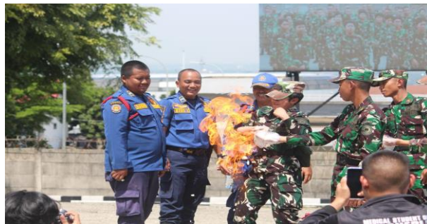
Gambar 3. Simulasi bencana kebakaran oleh Damkar distrik Citareup, Kab. Bogor