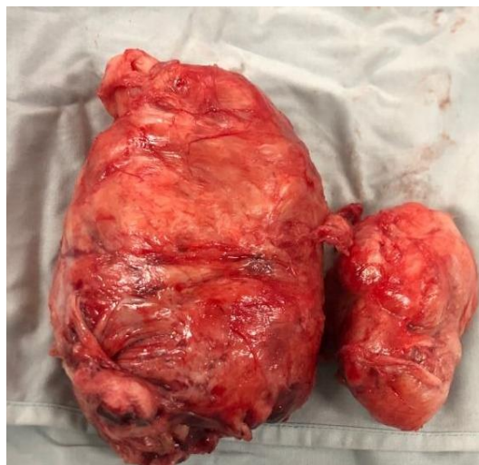
Gambar 2. Mioma Uteri Besar Berukuran 18 X 10 X 10 Cm Dan 8 X 5 X 5 Cm Yang Berhasil Diangkat Sebelum Melahirkan Bayi.