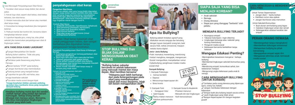
Gambar 2. Leaflet Tekstual Komunikatif

Melalui penelitian ini, siswa mulai memahami bahwa bullying memiliki bermacam bentuk, baik berbentuk fisik, verbal, maupun psikologis, serta dapat terjadi secara langsung maupun tidak langsung melalui media sosial. Penjelasan mengenai dampak bullying terhadap kesehatan mental, seperti stres, kecemasan, depresi, dan menurunnya rasa percaya diri memberikan pemahaman baru bagi siswa tentang seriusnya dampak dari perilaku tersebut.