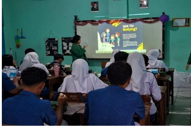
Gambar 1. Pemaparan Materi

Edukasi kesehatan yang interaktif dibantu dengan media leaflet merupakan salah satu strategi penting dalam promosi kesehatan remaja, karena pengetahuan yang didapatkan menjadi dasar terbentuknya sikap dan perilaku yang sehat. Remaja yang memiliki pemahaman yang baik diharapkan mampu mengenali perilaku berisiko serta mengambil keputusan yang tepat dalam kehidupan sehari-hari. Pelaksanaan kegiatan dilakukan melalui beberapa tahapan, yaitu tahap persiapan, tahap pelaksanaan, dan tahap evaluasi. Pada tahap persiapan, tim peneliti melakukan koordinasi dengan pihak sekolah untuk menentukan waktu dan teknis pelaksanaan kegiatan. Selain itu, dilakukan penyusunan materi penyuluhan yang disesuaikan dengan karakteristik remaja, serta penyusunan instrumen evaluasi berupa kuesioner pre-test dan post-test pada gambar 1.