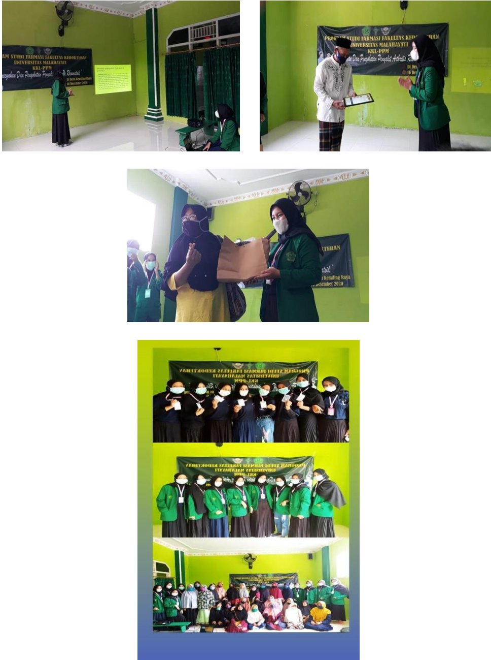
Gambar1. Pelaksanaan penyuluhan di Masjid Darul Falah Kemiling Raya