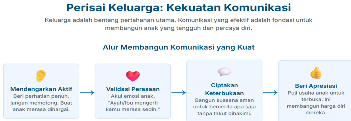
Gambar 2. Perisai Keluarga : Kekuatan Komunikasi