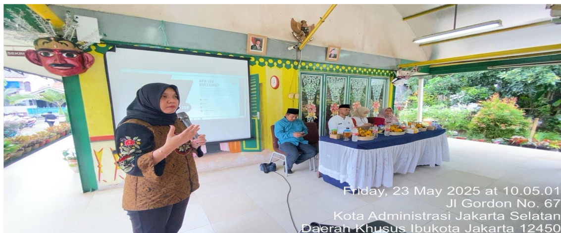
Gambar 3. Dokumentasi Kegiatan Pertemuan Rutin PKK Kelurahan Pondok Labu, Jakarta Selatan

Memberikan apresiasi dan pengakuan atas usaha anak, sekecil apapun pencapaian atau upaya mereka untuk berkomunikasi, adalah kunci lainnya. Ketika anak merasa usaha mereka dihargai, mereka akan lebih termotivasi untuk mencoba hal baru, mengatasi kesulitan, dan yang terpenting, merasa nyaman untuk terbuka dan berbagi dengan orang tua mengenai pengalaman mereka, termasuk jika mereka menghadapi masalah seperti perundungan. Apresiasi tidak harus selalu berupa hadiah materi, tetapi bisa berupa pujian tulus, pelukan, atau sekadar ucapan terima kasih karena telah berbagi cerita.