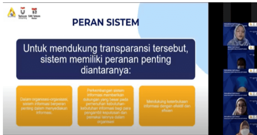
Gambar 3. Penyampaian Materi